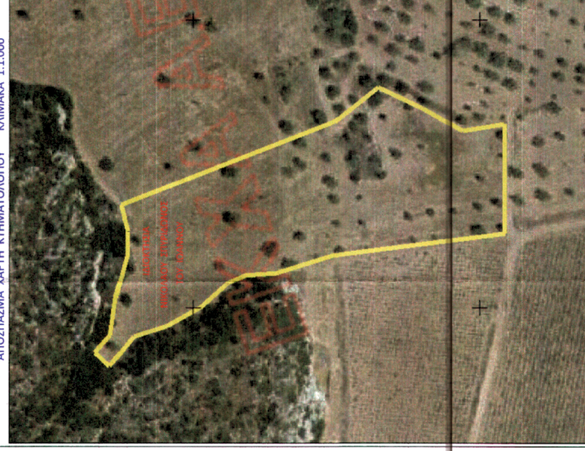
ΑΠΟΣΠΑΣΜΑ ΧΑΡΤΗ ΚΤΗΜΑΤΟΛΟΓΙΟΥ ΚΛΙΜΑΚΑ 1:1.000