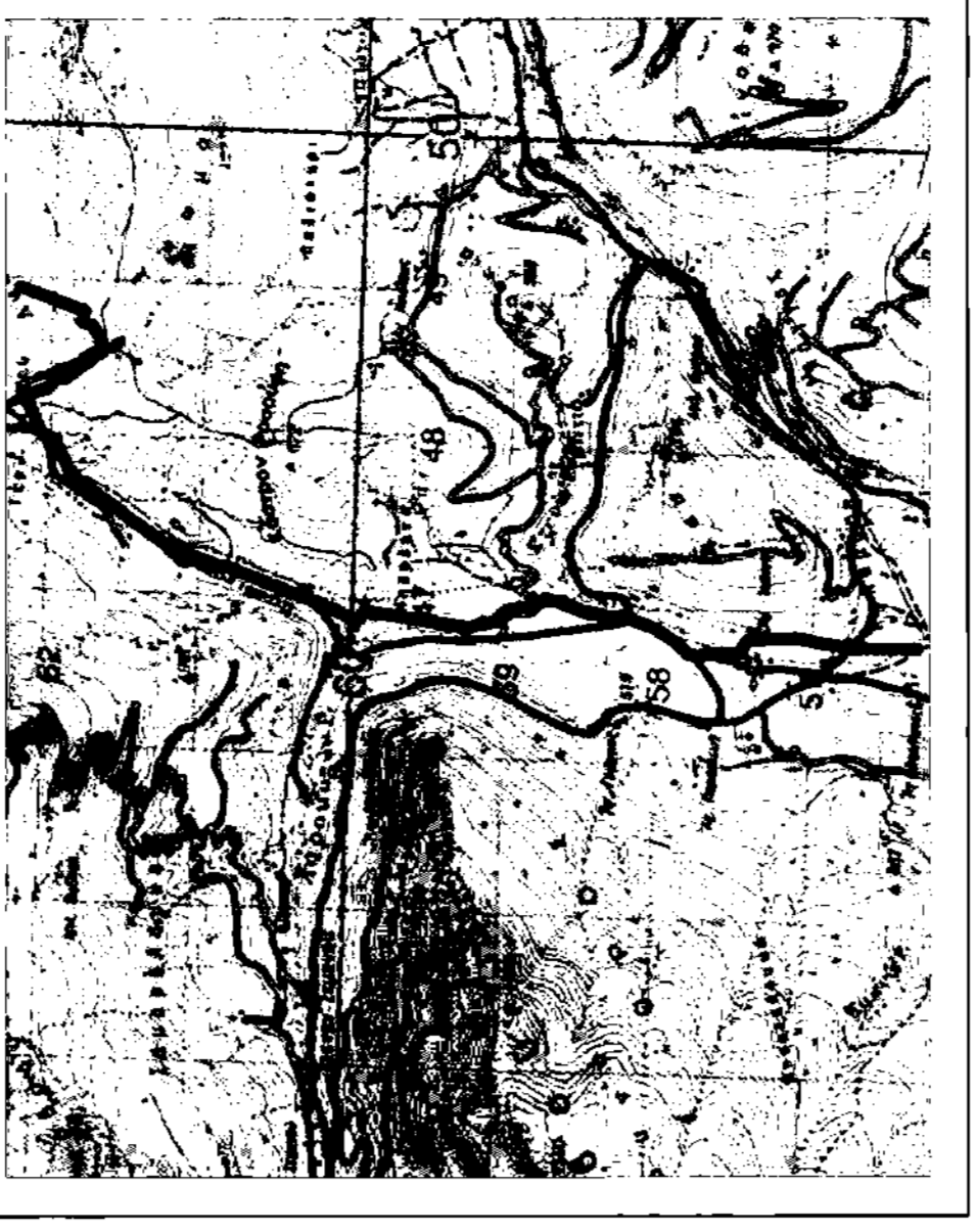
ΑΠΟΤΥΠΩΣΗ ΚΑΘΙΣΤΗ ΚΑΙ 1:50,000 ΠΕΡΙΟΧΗΣ ΚΑΤΑΣΚΕΥΗΣ ΤΟΥ ΕΡΓΟΥ