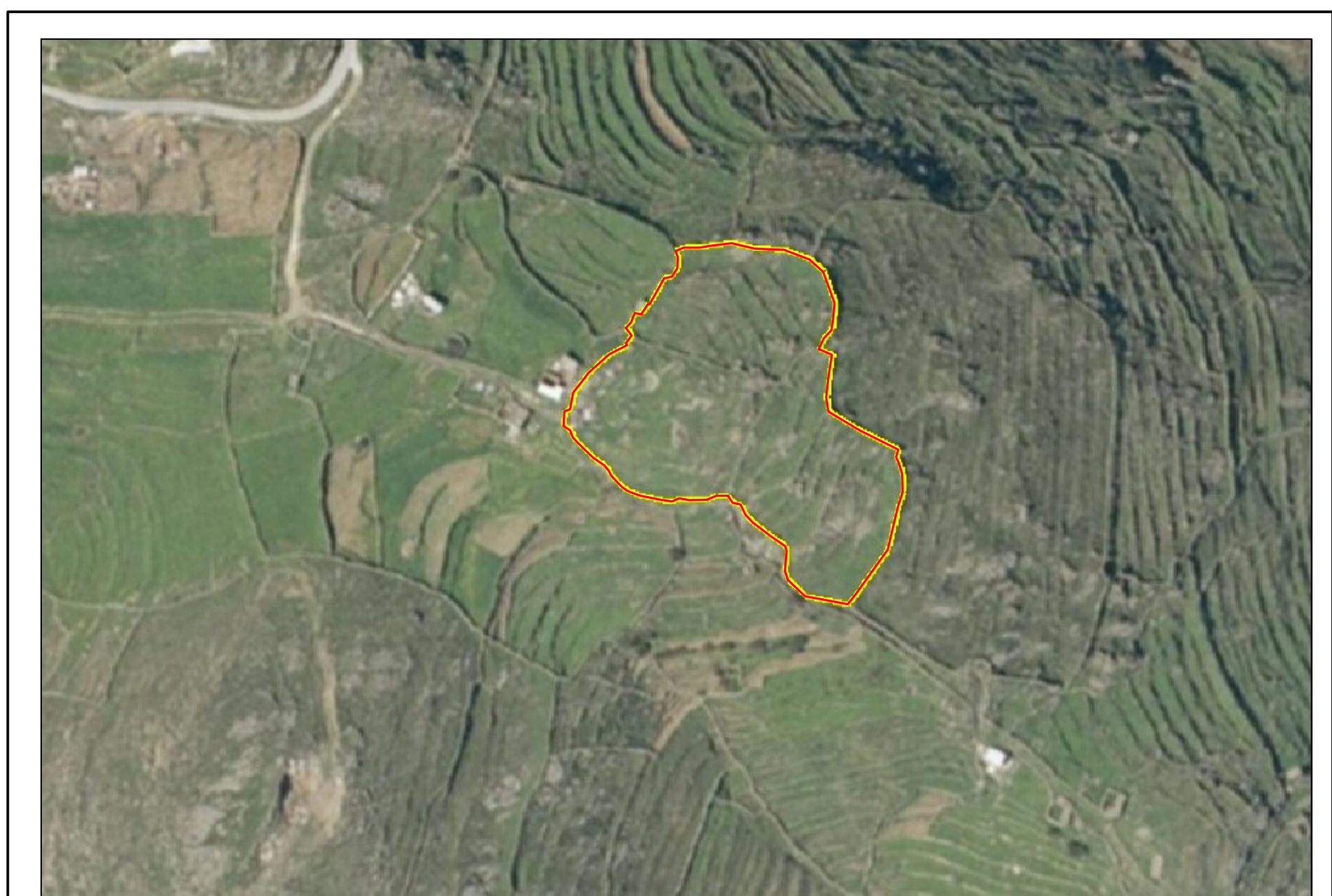
ΑΕΡΙΑΙΑ ΧΑΡΤΟΓΡΑΦΙΑ ΤΗΣ ΠΡΟΣΤΑΣΙΑΣ ΕΣΚΟΤ ΚΗΛΙΔΙΟΥ