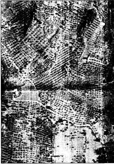
ΑΕΡΟΦΩΤΟΓΡΑΦΙΑ ΚΤΗΜΑΤΟΛΟΓΙΟΥ Δ.Ε.