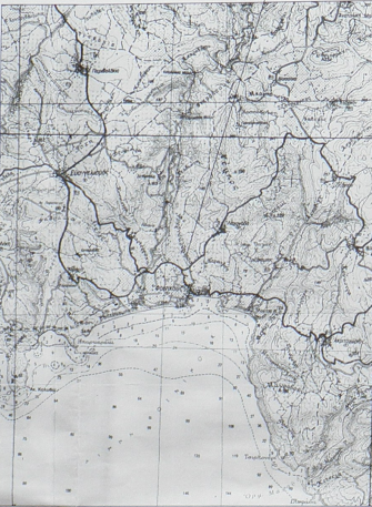
ΑΠΟΣΠΑΣΜΑ ΦΥΛΛΟΥ ΧΑΡΤΗ Γ.Υ.Σ. (Κορώνη) ΚΑΙΜΑΚΑΣ 1:5000 Θέση ιδιοκτησίας