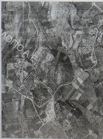
ΑΠΟΣΠΑΣΜΑ ΟΡΘΟΦΩΤΟΧΑΡΤΗ ΚΤΗΜΑΤΟΛΟΓΟΥ Δ.Ε. ΚΑΙΜΑΚΑΣ 1:5000 Θέση ιδιοκτησίας