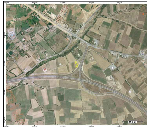
ΔΟΔΟΛΟΓΙΚΟ ΣΧΗΜΑΤΑ - ΚΛΙΜΑΚΑ 1:10000

Το αγροτεμάχιο υπό στοιχεία Α1-Α2-Α3-Α4-Α5-Α6-Α7-Α11 υψοσώ 1216,70 τμ, προέκυψε από μείζονα έκταση επιφανείας 4833,00 τμ. (σημειώση 16252/13-07-2007) τμήμα της οδού απαλλοτριωμένης για την κατασκευή του Ανατολικού κλάδου Κομοτηνής της Εγνατίας Οδού. Σύμφωνα με το συμβόλαιο το αγροτεμάχιο με υψοσώ 4833,00 προήλθε το έτος 1955.