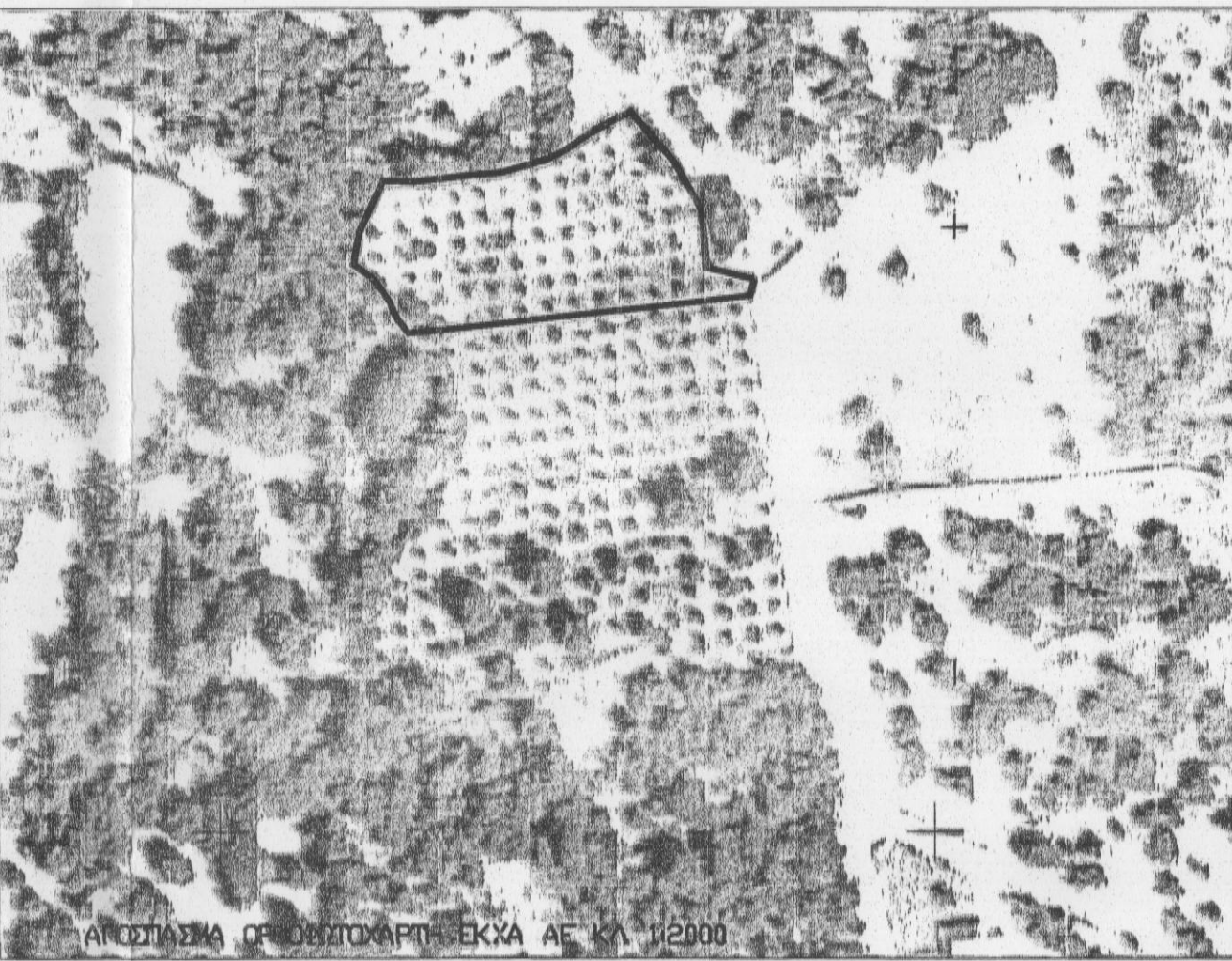
Αεροφωτογραφία ΟΡΘΟΡΡΟΜΗ ΕΚΧΑ ΑΕ ΚΑΙ 1:2000