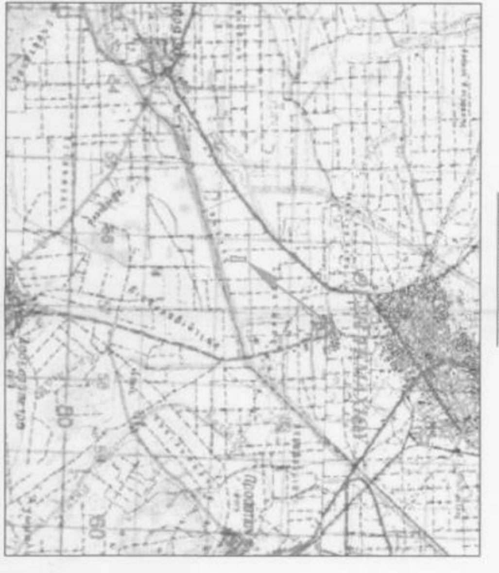
ΑΠΟΙΣΙΑΣΜΑ ΧΑΡΤΗ ΓΥΣ ΚΑΙΜΑΚΑ 1:50000