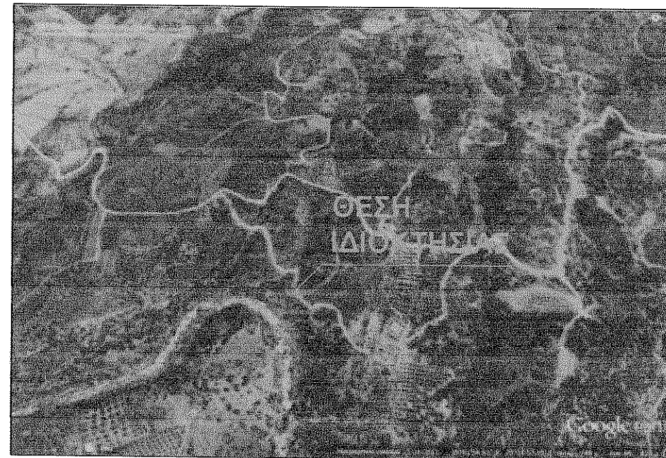
ΑΠΟΣΠΑΣΜΑ ΑΠΟ ΧΑΡΤΗ GOOGLE