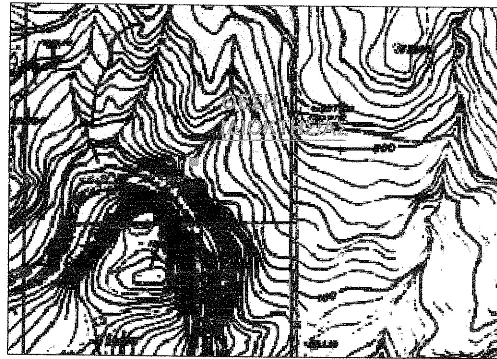
Αποσπασμα απο φωτογραφικο διάγραμμα έκδοση Γ.Υ.Σ. κλίμακα διαγράμματος 1:5000 (Φ.Χ.96406α)