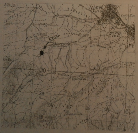
ΑΠΟΣΠΑΣΜΑ ΧΑΡΤΗ ΓΥΣ 1:50.000

ΔΗΜΙΩΝ ΥΠΟΛΟΓΙΣΤΗΣ ΟΡΙΩΝ Ο ΠΑΡΑΚΑΤΩ ΥΠΟΓΡΑΦΩΝ ΔΗΜΙΩΝ ΥΠΕΥΘΥΝΑ ΟΤΙ ΤΑ ΟΡΙΑ ΤΗΣ ΕΚΤΑΣΗΣ ΠΟΥ ΦΑΙΝΟΝΤΑΙ ΣΤΟ ΠΑΡΑΚΑΤΩ ΔΙΑΓΡΑΜΜΑ ΜΕ ΣΤΟΙΧΕΙΑ Α,Β,Γ,Δ...Α ΤΑ ΥΠΕΒΑΙΒΑ ΕΙΣΤΕ ΣΤΗ ΜΗΧΑΝΙΚΗ ΚΑΙ ΑΠΟΤΥΠΩΣΗΚΑΝ ΟΡΘΑ Ο ΔΗΜΙΩΝ ΚΟΤΟΡΡΙ ΣΑΒΡΙ