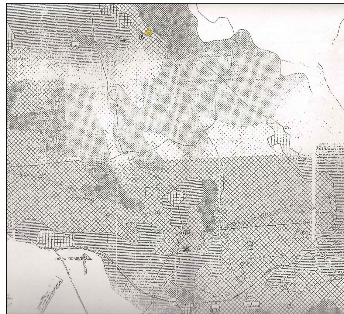
ΑΠΟΣΠΑΣΜΑ ΑΠΟ ΣΥΝΘΗΚΗ ΡΑΜΣΑΡ