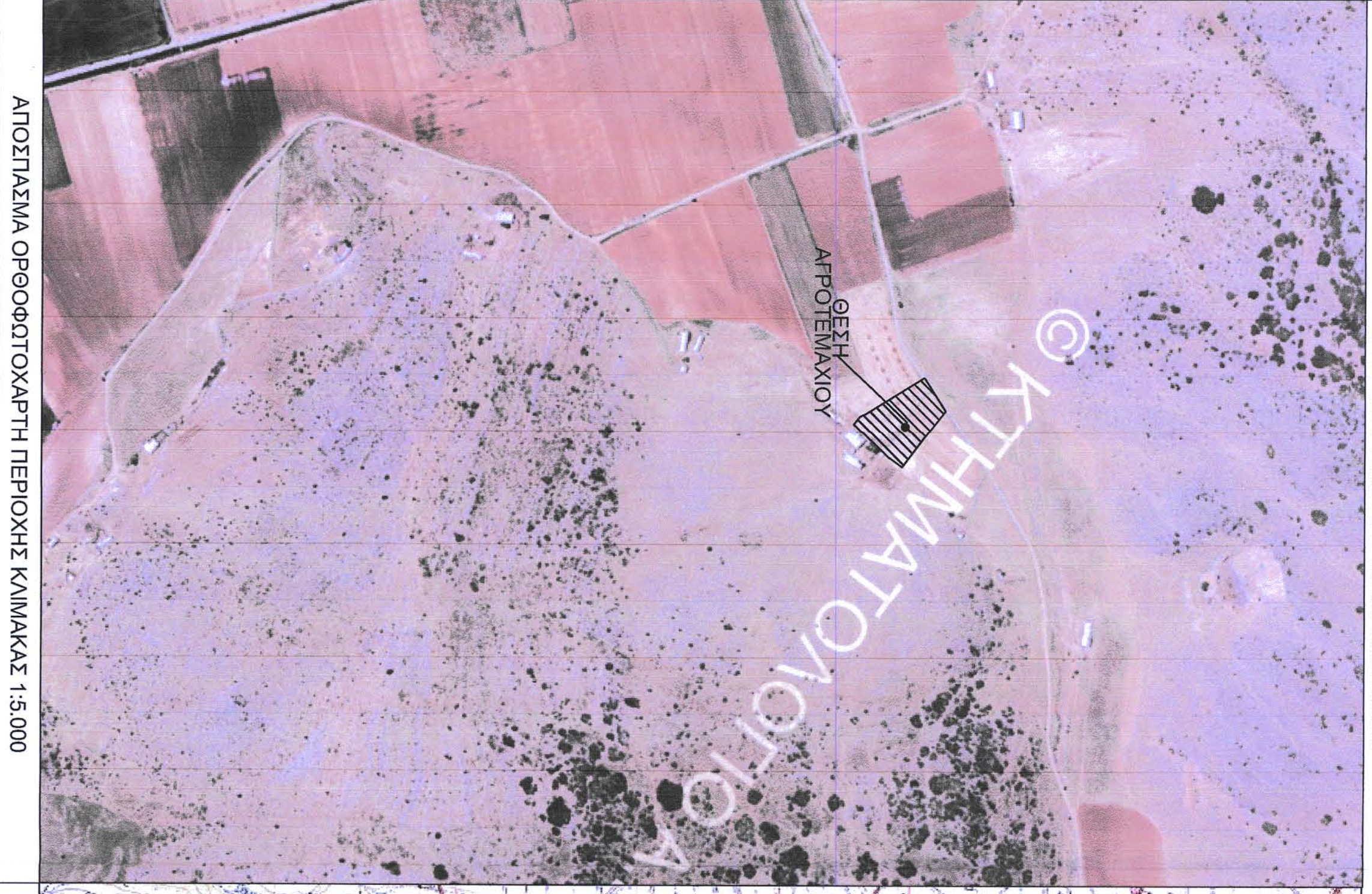
ΑΠΟΣΠΑΣΜΑ ΟΡΘΟΦΩΤΟΧΑΡΤΗ ΠΕΡΙΟΧΗΣ ΚΑΙΜΑΚΑΣ 1:5.000