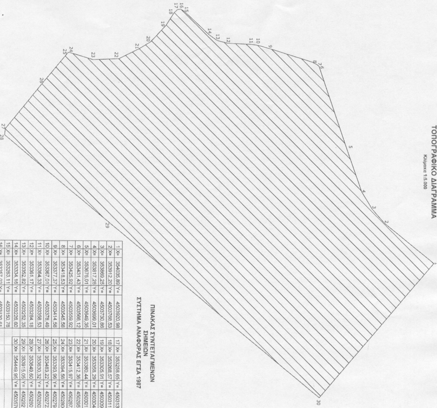
ΠΙΝΑΚΑΣ ΣΥΝΤΕΤΑΓΜΕΝΩΝ ΣΗΜΕΙΩΝ ΣΥΣΤΗΜΑ ΑΝΑΦΟΡΑΣ ΕΓΓΛΑ 1987