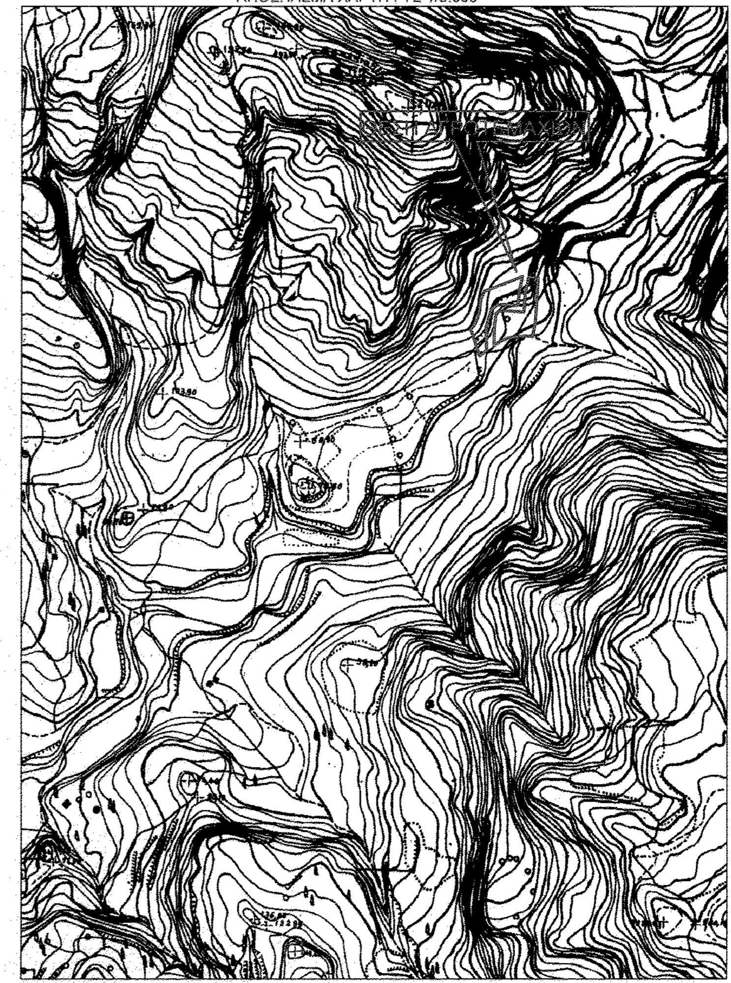
ΣΥΝΤΕΤΑΓΜΕΝΕΣ ΚΟΡΥΦΕΣ ΕΘΝΙΚΟ ΤΡΙΓΩΝΟΜΕΤΡΙΚΟ ΔΙΚΤΥΟ (ΠΡΟΒΟΛΗ ΕΓΣΑ '87)