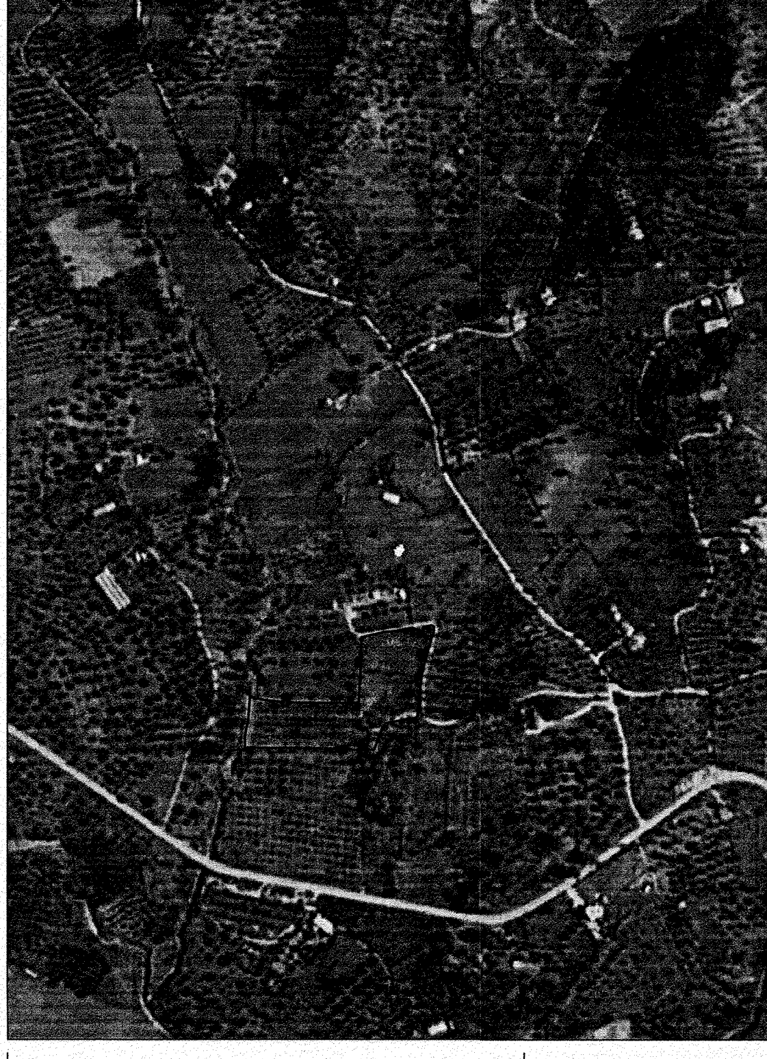
ΠΙΝΑΚΑΣ ΣΥΝΤΕΤΑΓΜΕΝΩΝ ΟΡΙΩΝ ΤΗΣ ΙΔΙΟΚΤΗΣΙΑΣ ΣΕ ΠΡΟΒΟΛΙΚΟ ΣΥΣΤΗΜΑ ΕΓΣΑ 87