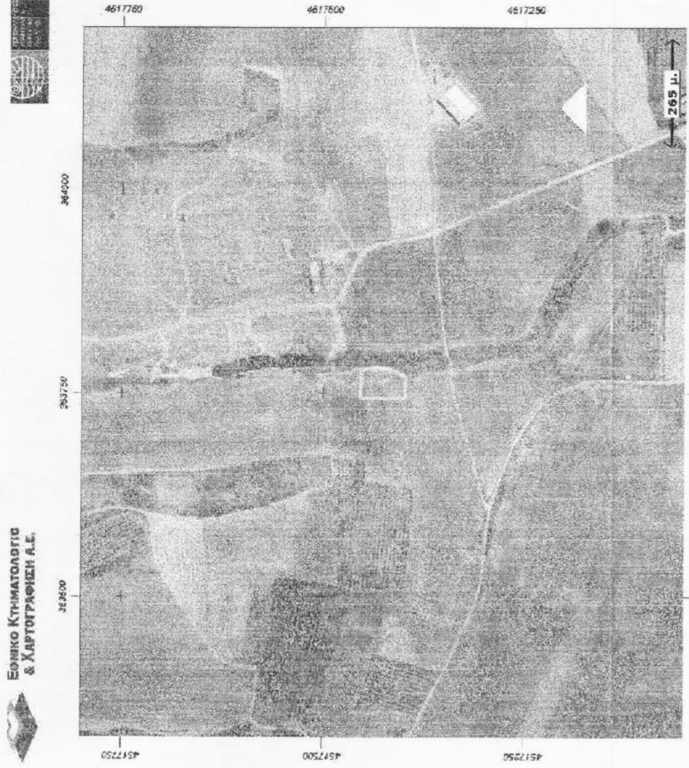
ΑΠΟΣΤΑΣΜΑ ΑΠΟ ΔΙΑΓΡΑΜΜΑ ΔΙΑΝΟΜΗΣ ΑΓΡΟΚΤΗΜΑΤΟΣ ΓΙΑΝΝΙΤΣΩΝ ΜΕ ΑΡΙΘ. ΦΥΛΛΟΥ 1 ΚΑΙΜΑΚΑ 1.5000