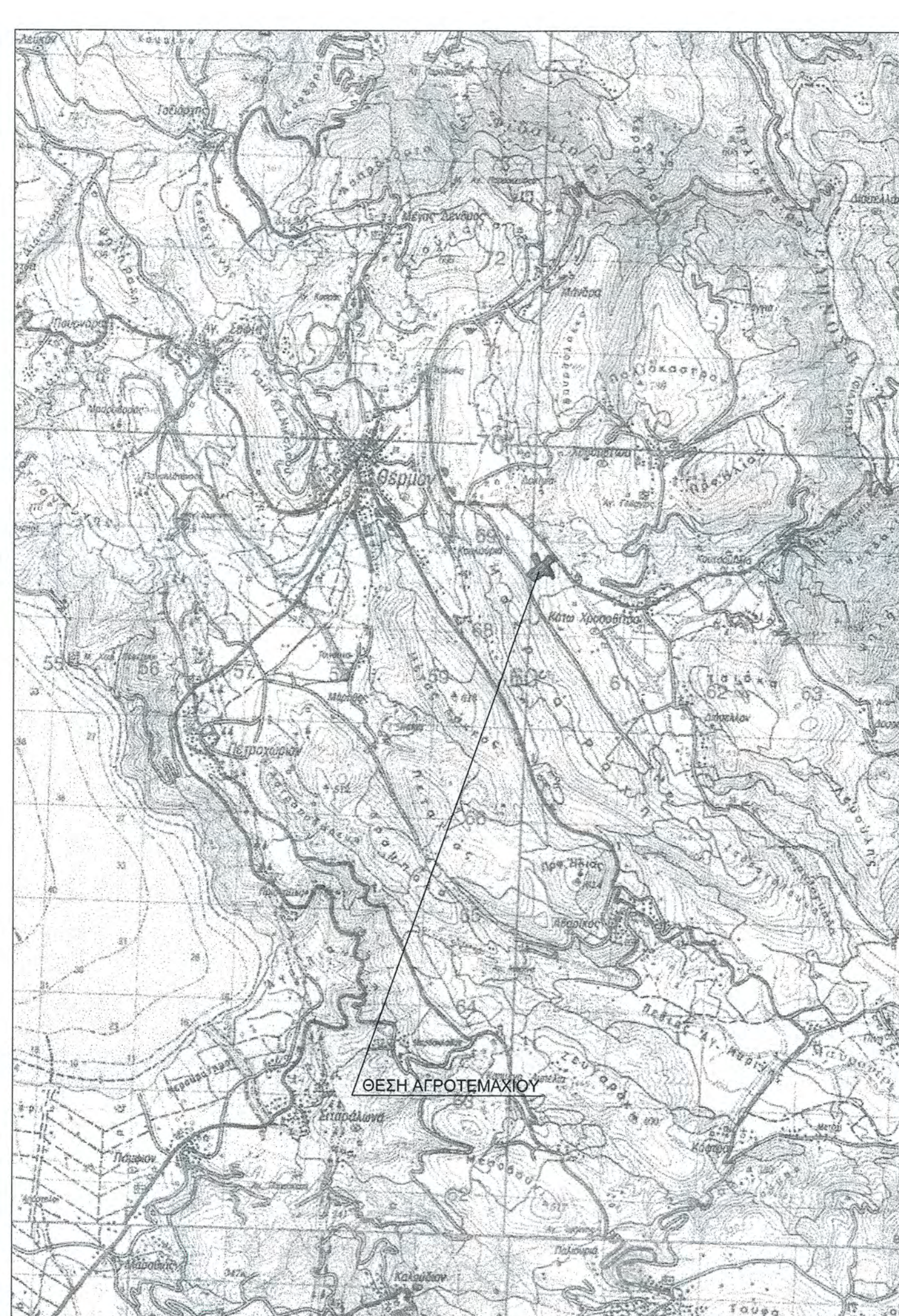
ΑΠΟΣΠΑΣΜΑ ΧΑΡΤΗ Γ.Υ.Σ. ΚΑΙΜΑΚΑ 1:50000 ΘΕΣΗ ΑΓΡΟΤΕΜΑΧΙΟΥ