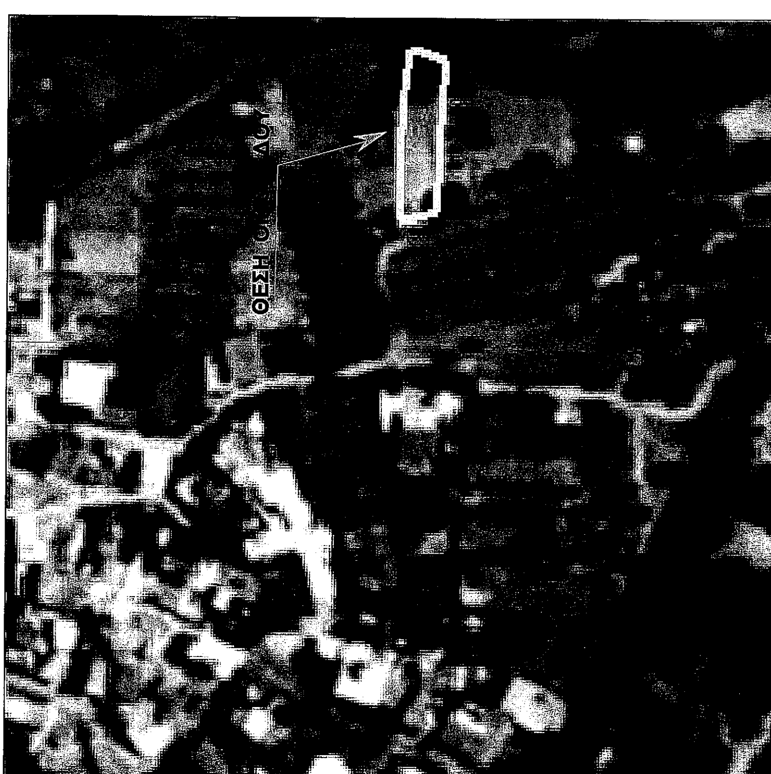
ΑΠΟΣΠΑΣΜΑ ΑΠΟ ΚΤΗΜΑΤΟΛΟΓΙΟ