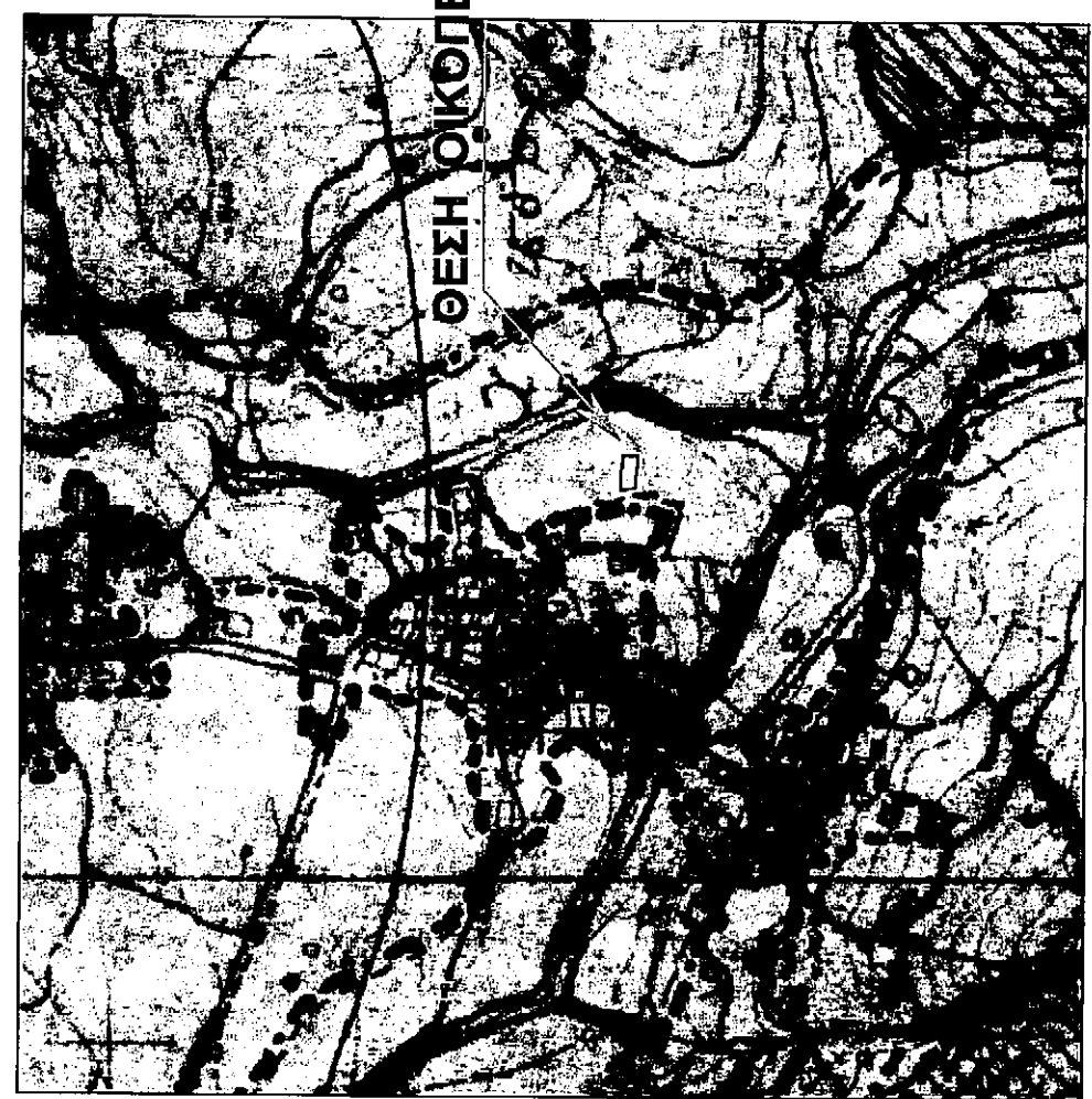
ΑΠΟΣΠΑΣΜΑ ΧΑΡΤΗ Γ.Υ.Σ.