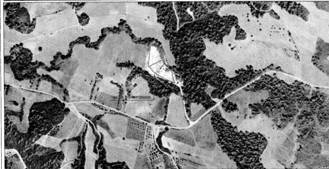
ΑΠΟΣΠΑΣΜΑ ΟΡΘΟΦΩΤΟΧΑΡΤΗ Α/Φ ΕΤΟΥΣ ΛΗΨΗΣ 2009