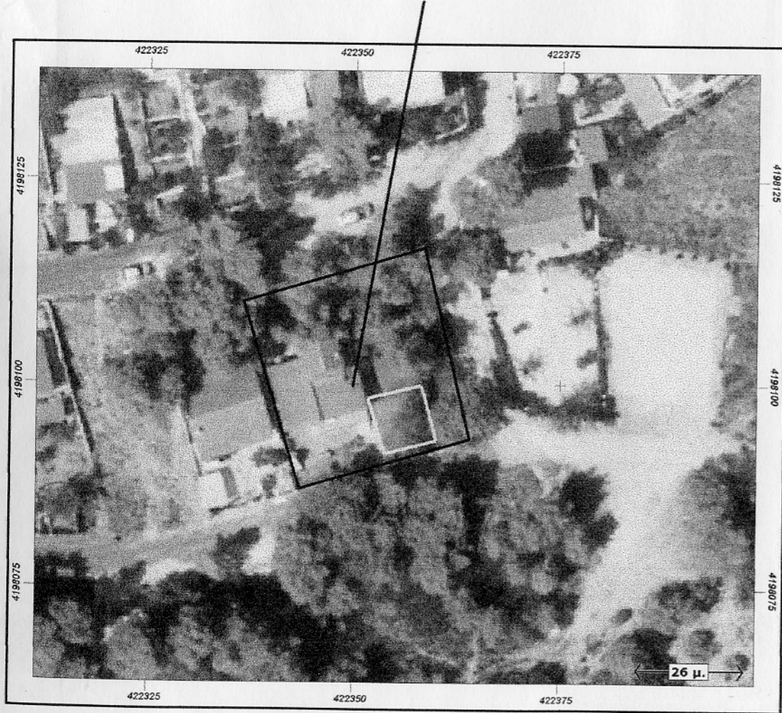
ΑΠΟΣΠΑΣΜΑ ΟΡΘΟΦΩΤΟΧΑΡΤΗ ΤΗΣ ΚΤΗΜΑΤΟΛΟΓΙΟ Α.Ε.