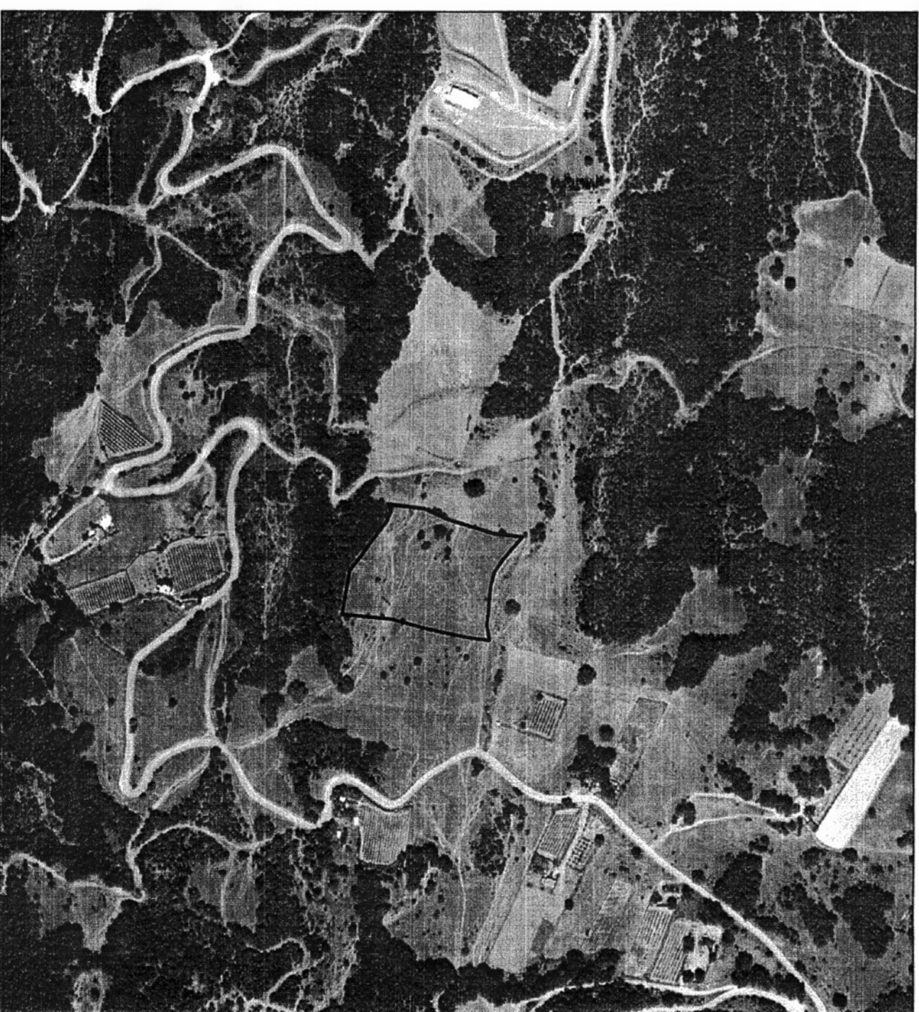
Θέση αγροτεμαχίου (A1, A2, ..., A17, A1) σε δορυφορική απεικόνιση, κλίμακας 1:5000