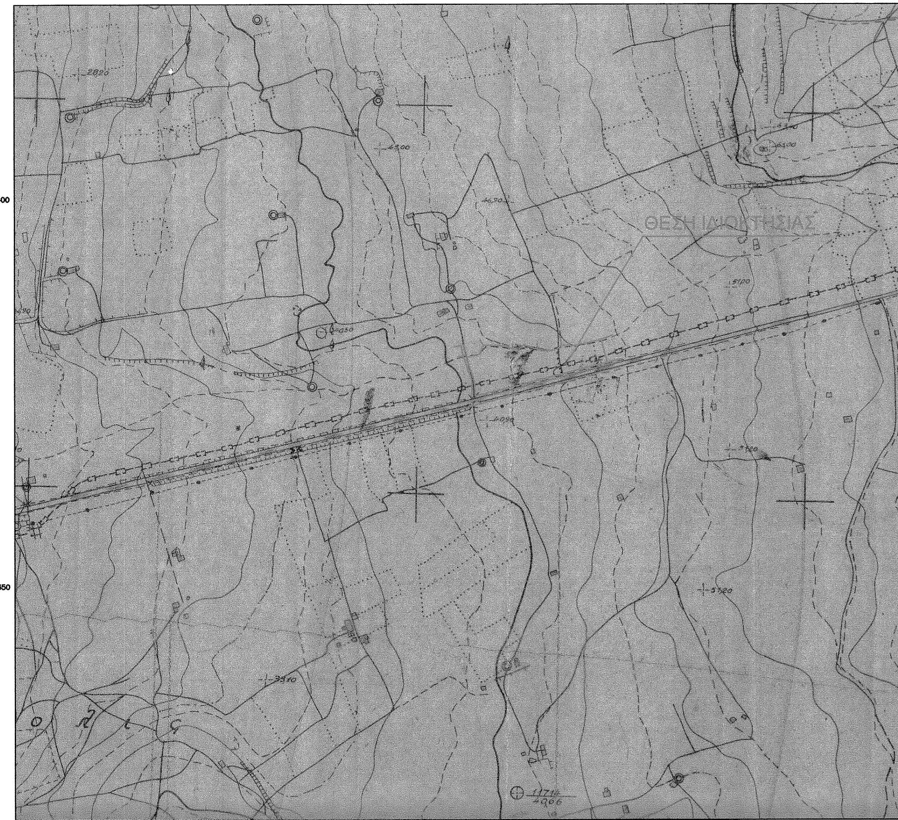
ΑΠΟΣΠΑΣΜΑ ΑΠΟ ΦΧ ΤΗΣ ΓΥΣ ΚΛΙΜΑΚΑ 1:5000 7243/4