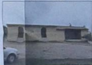
ΑΝΑΤΟΛΙΚΗ ΟΨΗ ΦΩΤΟΓΡΑΦΙΑ 1

ΙΔΙΟΚΤΗΣΙΑ ΕΝΟΡΙΑΚΟΥ ΙΕΡΟΥ ΝΑΟΥ ΚΟΙΜΗΣΕΩΣ ΤΗΣ ΘΕΟΤΟΚΟΥ