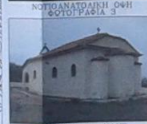
ΣΧΗΜΑ ΔΗΜΗΣ ΦΩΤΟΓΡΑΦΙΟΝ