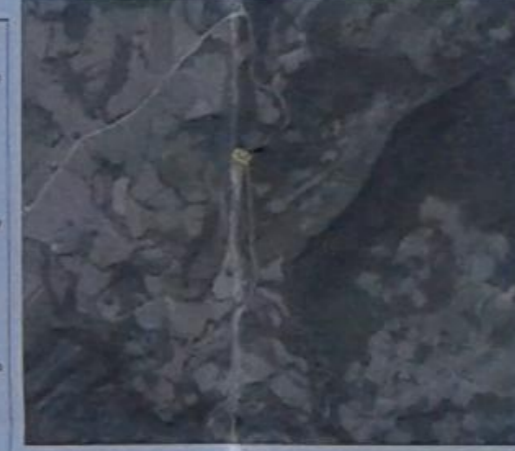
ΑΠΟΣΠΑΣΜΑ ΟΡΘΟΦΩΤΟΧΑΡΤΗ ΚΤΗΜΑΤΟΛΟΓΙΟΥ ΚΑΙΜΑΚΑ 1:10.000

ΙΔΙΟΚΤΗΣΙΑ ΕΝΟΡΙΑΚΟΥ ΙΕΡΟΥ ΝΑΟΥ ΚΟΙΜΗΣΕΩΣ ΤΗΣ ΘΕΟΤΟΚΟΥ