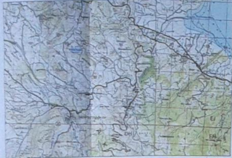
ΑΠΟΣΠΑΣΜΑ ΦΥΛΛΟΥ ΧΑΡΤΗ Γ.Υ.Σ. ΒΟΝΙΤΣΑ 074-ΑΜΦΙΛΟΧΙΑ 039 ΚΑΙΜΑΚΑ 1:50.000

ΙΔΙΟΚΤΗΣΙΑ ΕΝΟΡΙΑΚΟΥ ΙΕΡΟΥ ΝΑΟΥ ΚΟΙΜΗΣΕΩΣ ΤΗΣ ΘΕΟΤΟΚΟΥ