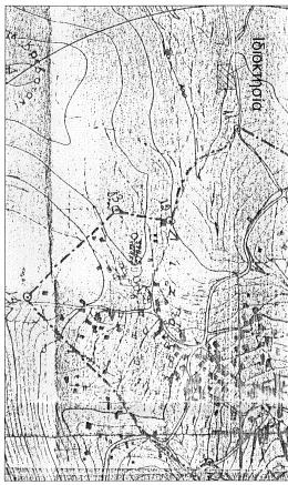
ΑΠΟΣΤΑΣΙΑ ΧΑΡΤΗ Γ.Υ.Σ. - ΚΑ. 1:5.000