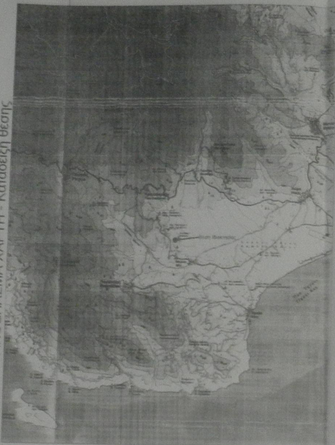
ΑΠΟΣΠΑΣΜΑ ΧΑΡΤΗ - Κατάδειξη θέσης