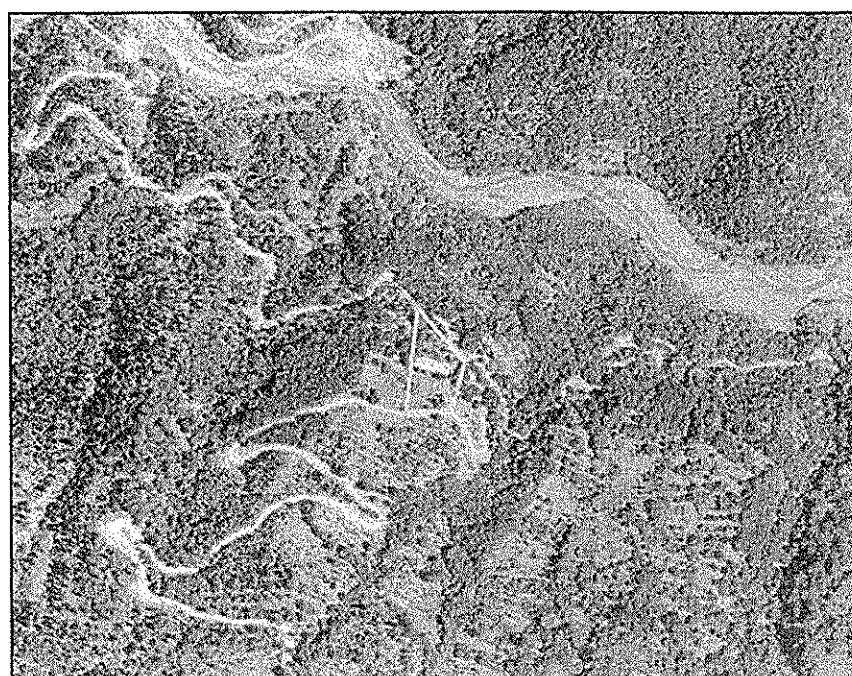
ΑΠΟΣΠΑΣΜΑ ΟΡΘΟΦΩΤΟΓΡΑΦΙΑΣ ΚΤΗΜΑΤΟΛΟΓΙΟΥ Α.Ε.