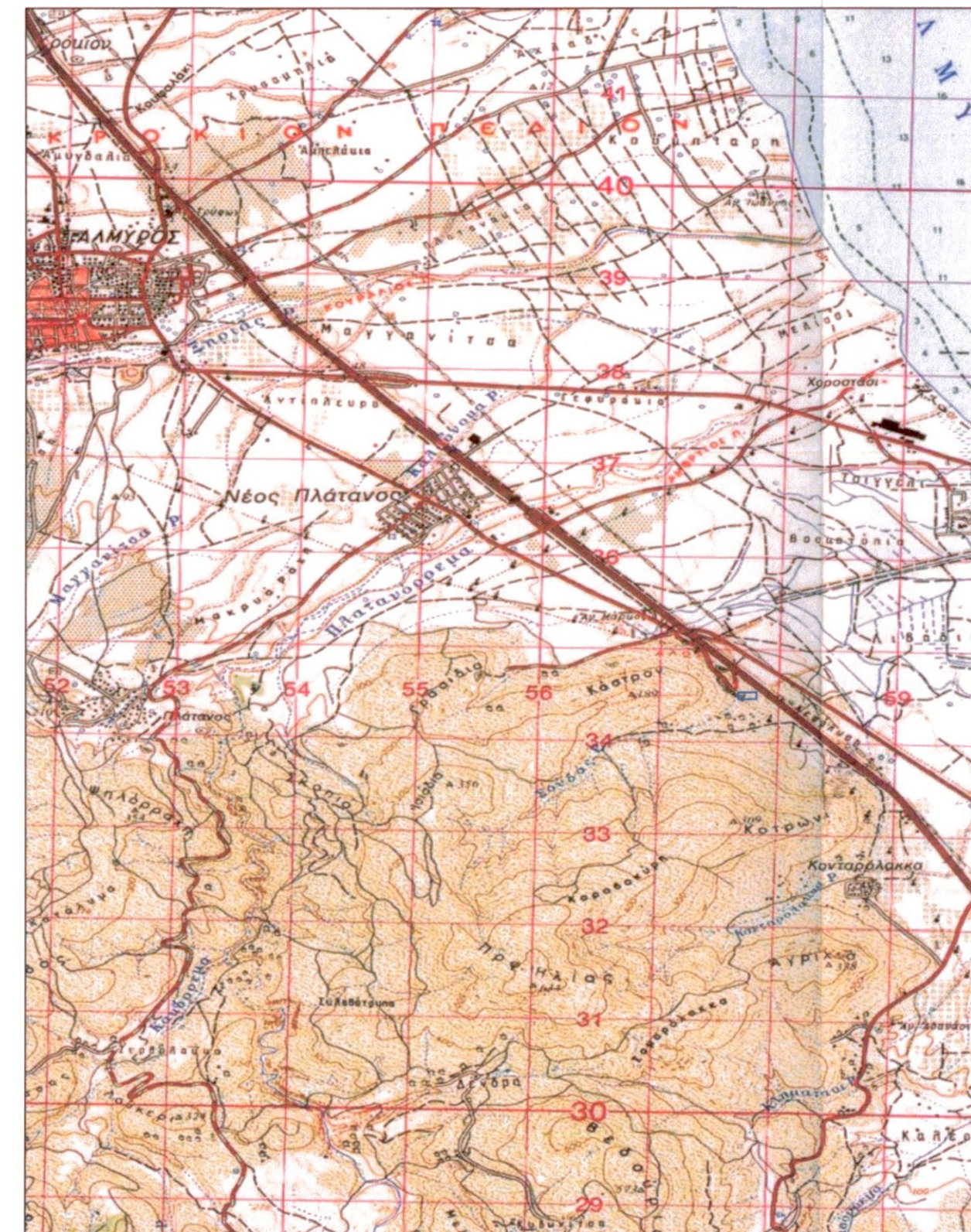
ΑΠΟΣΠΑΣΜΑ ΧΑΡΤΗ ΓΥΣ ΣΕ ΚΛΙΜΑΚΑ 1 ΠΡΟΣ 5000 0