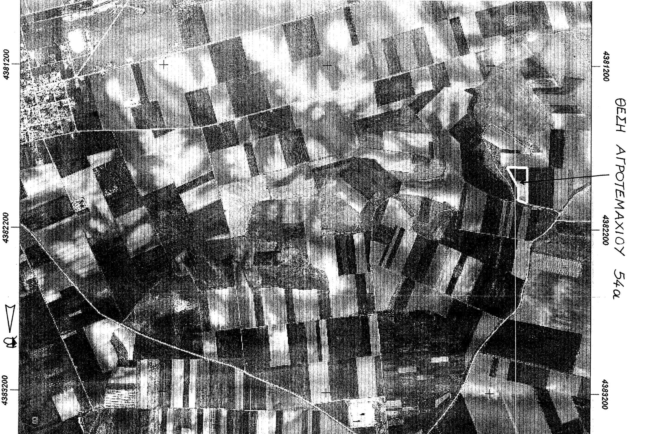
ΘΕΣΗ ΑΓΡΟΤΕΜΑΧΙΟΥ 54α