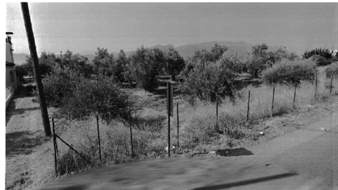
ΦΩΤΟΓΡΑΦΙΑ ΑΠΟ ΘΕΣΗ ΛΗΨΗΣ 2

Όροι δόμησης Άρθρο 1 Π.Δ 24/31.5.1985 (ΦΕΚ 270Δ) Παρεκκλιση άρθρο 1 παρ.2.β.γ του ΠΔ/24-5-85 Ελάχιστο εμβαδόν: 4000 μ 2 Ελάχιστο πρόσωπο: 45μ Ελάχιστο βάθος: 50μ Κάλυψη: 30% x 3187.40=956.22 μ 2 Δόμηση: 0.90 x 3187.40 = 2868.66 μ 2 Ύψος: 11,00 μ + 1.20 μ (στέγη) Ορόφοι: 3 Πλάγιες αποστάσεις: 10.00 μ