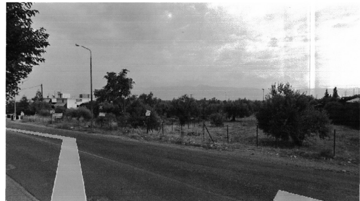
ΦΩΤΟΓΡΑΦΙΑ ΑΠΟ ΘΕΣΗ ΛΗΨΗΣ 1