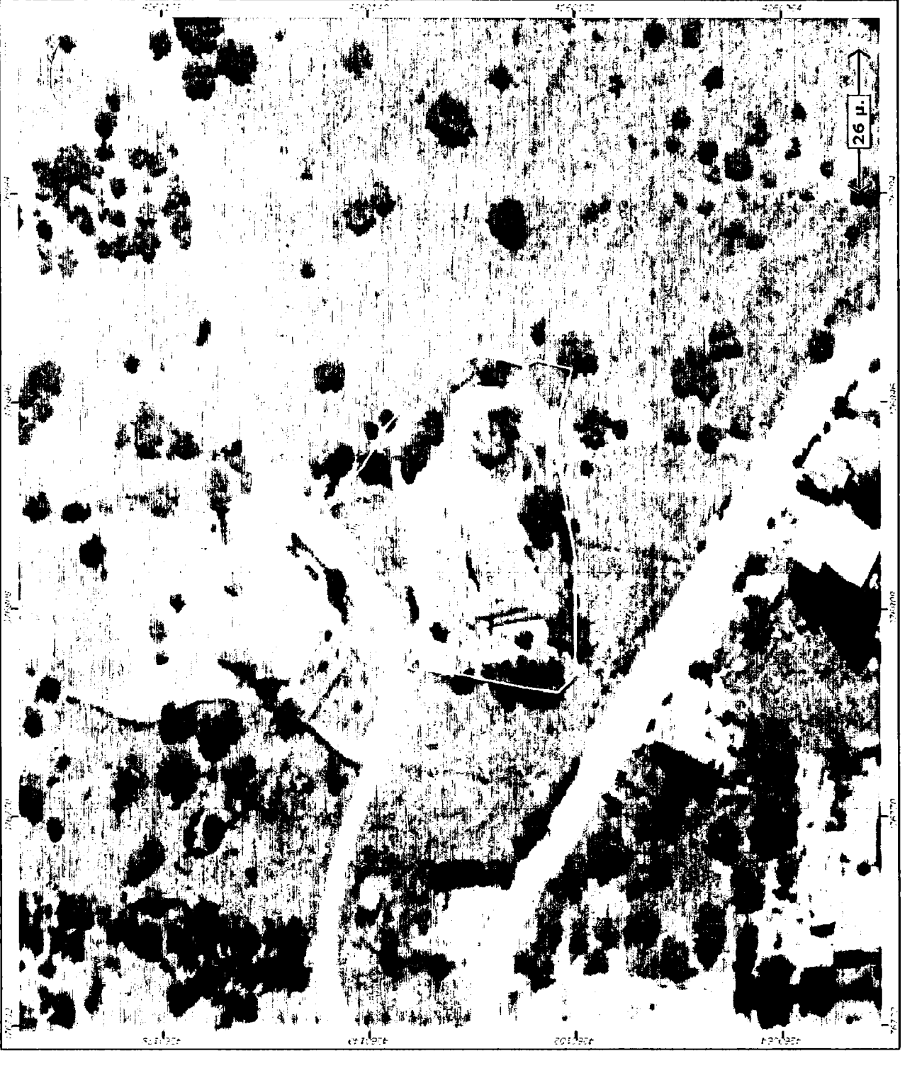
ΔΙΟΣΠΑΣΜΑ ΔΟΡΥΦΟΡΙΚΗΣ ΕΙΚΟΝΑΣ ΔΗΜΟΤΙΚΗΣ ΚΟΙΝΟΤΗΤΑΣ ΑΡΧΑΙΑΣ ΔΗΜΟΥ ΔΙΔΩΜΟΥ - ΑΡΧΑΙΑΣ - ΑΝΤΙΚΥΡΑΣ (πηγή: http://gis.ktimamet.gr/ )

ΔΙΔΩΣΗ ΜΗΧΑΝΙΚΟΥ: Διπλόνο με τον Ν. 4178/2013 και σε συνδυασμό με τον 2254/2013 (απόφαση ΥΠΕΚΑ), δηλώνει ότι: 1) ο κτήσης οικόπεδος της Διοκτείας, στις διατάξεις του Ν. 4178/2013 είναι: 2) έργο στην ιδιοκτησία του δικαιολογητικού στοιχείου και της μελέτης και ότι τα υψόμετρα πρακτορικών εκτός της προβλεπόμενης προβάθμιας γη το σχέδιο είναι ταύτοσημο με εκείνο που θα σταθωθεί πρακτορικά στο ΥΠΕΚΑ Ο ΔΗΜΩΝ ΧΡΗΣΤΟΣ Γ. ΚΥΡΠΑΙΟΣ ΔΙΔΩΣΗ ΜΗΧΑΝΙΚΟΥ