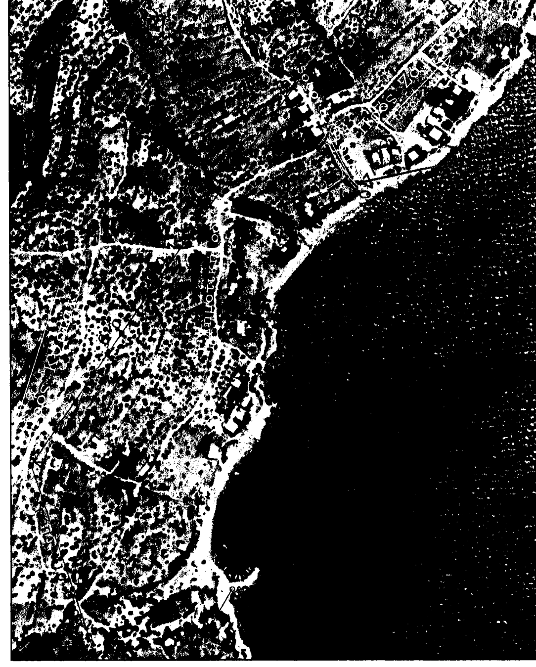
Απόσταση από τον ορθοφωτοκάρτη της περιοχής. θέση ιδιοκτησίας Κλίμακα 15000 Όρια οικισμού 123.4.5.6