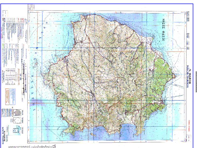
КАРТА БЪЛГАРИЯ 1:1,000,000