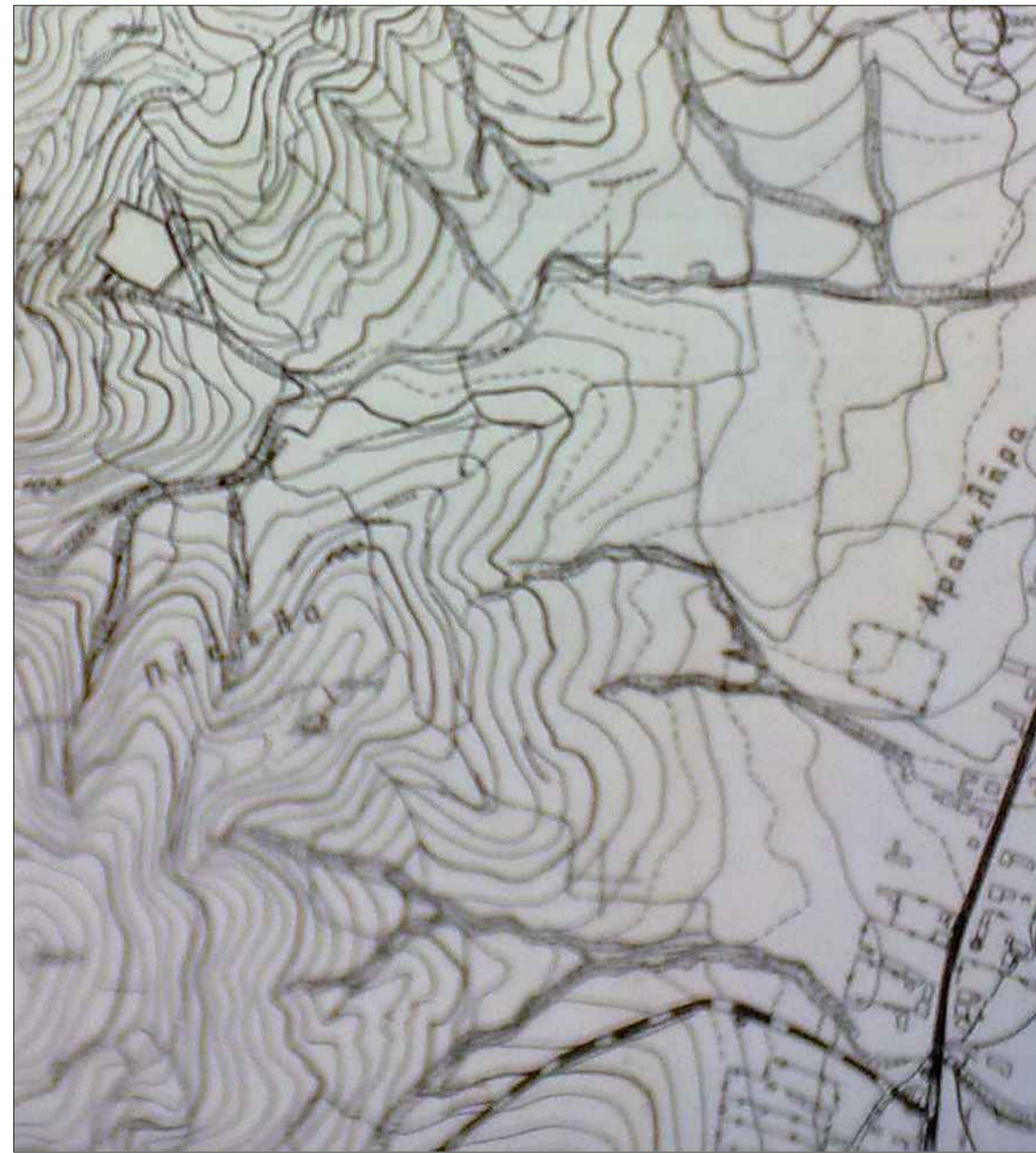
ΑΠΟΣΠΑΣΜΑ ΧΑΡΤΗ ΚΛ. 1:5.000