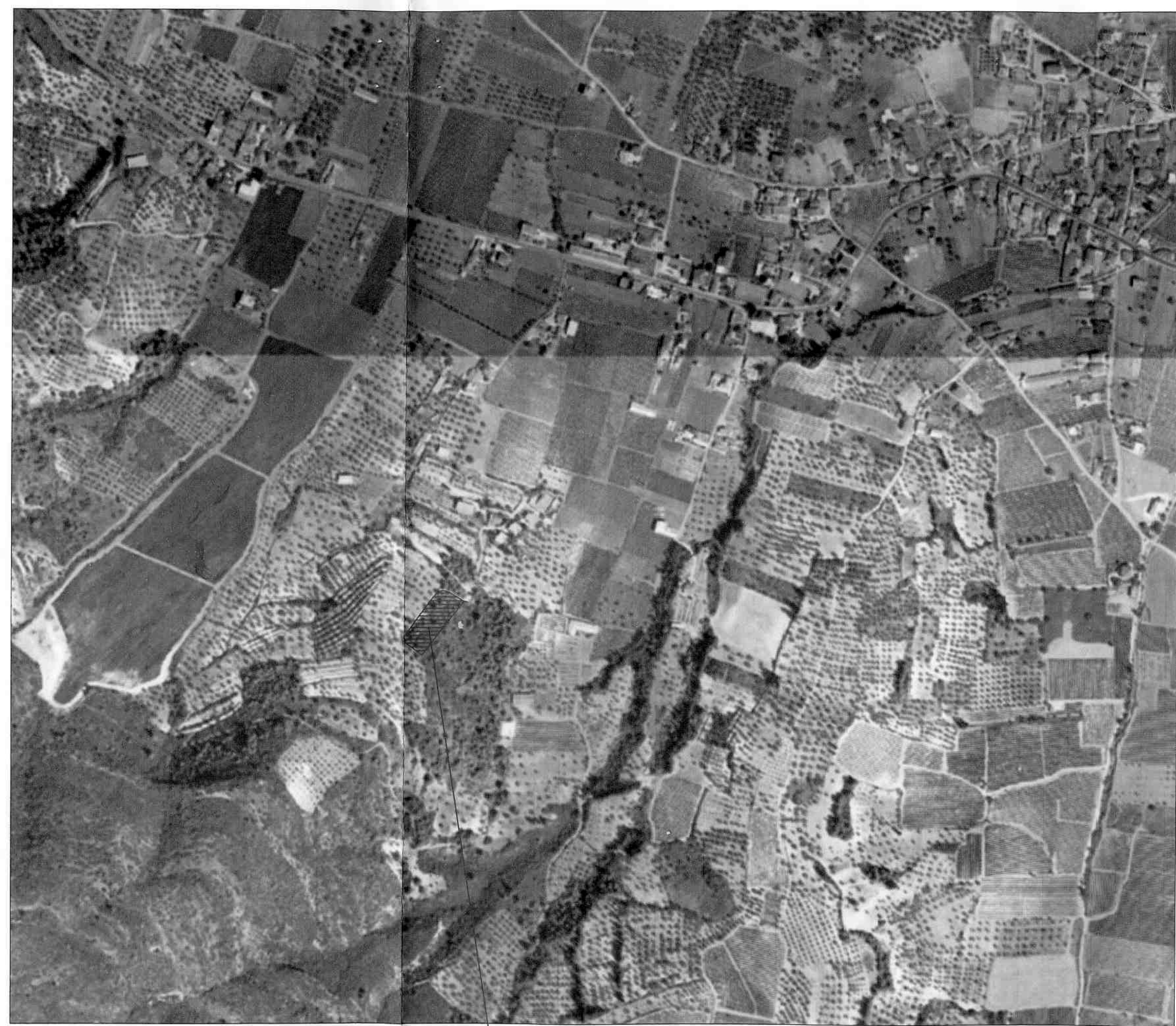
ΑΠΟΣΠΑΣΜΑ ΟΡΘΟΦΩΤΟΧΑΡΤΗ 1:5000 ΕΜΦΑΙΝΟΝ ΤΗΝ ΙΔΙΟΚΤΗΣΙΑ ΓΕΩΡΓΟΥΣΗ-ΑΝΑΓΝΩΣΤΑΡΑ