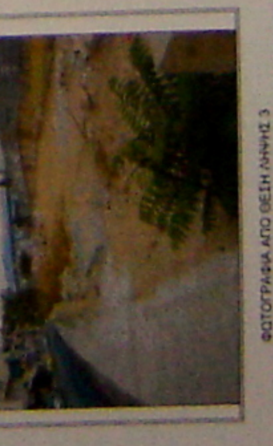
475008 ΦΩΤΟΓΡΑΦΙΑ ΑΠΟ ΒΕΣΗ ΑΓΝΗΣ 3