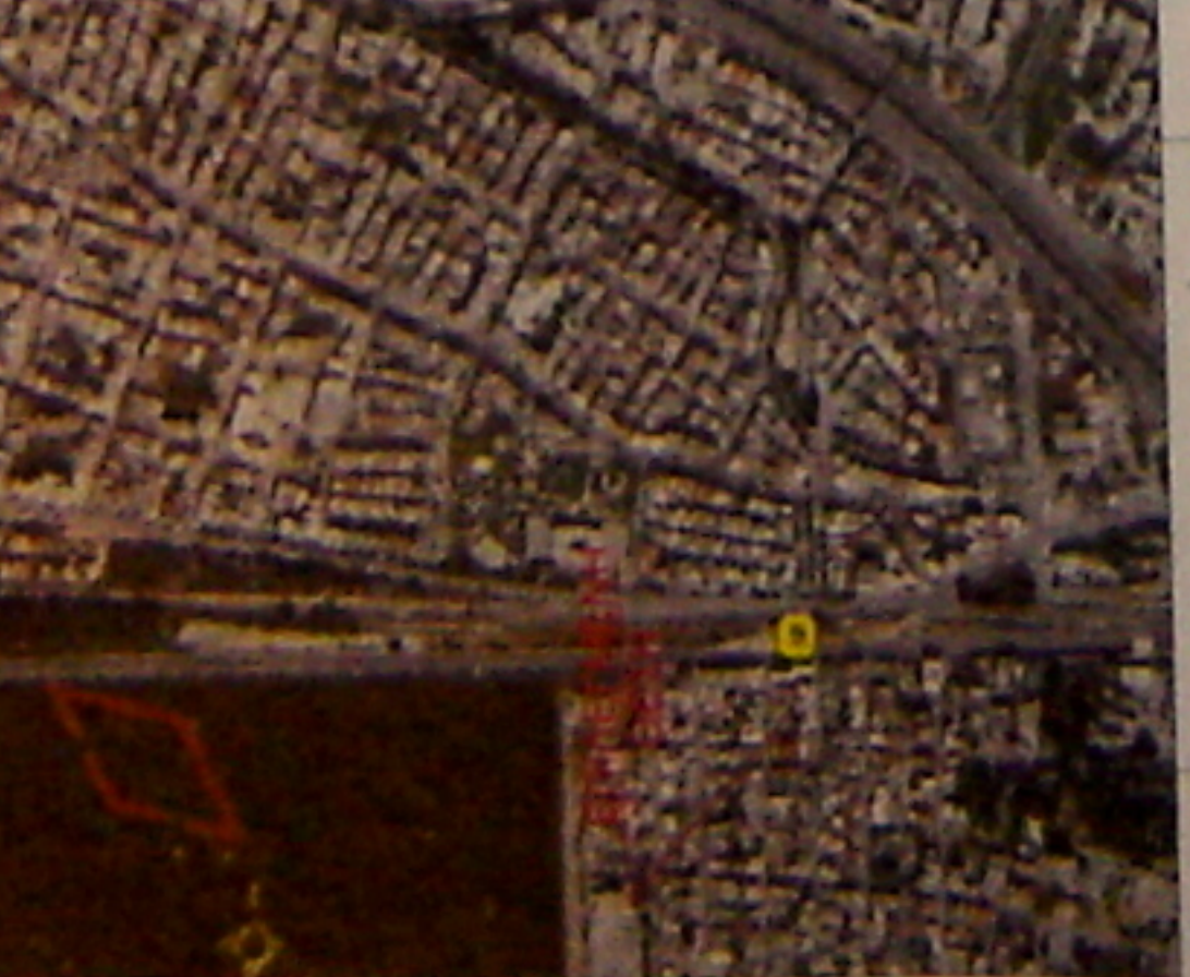
475006 ΦΩΤΟΓΡΑΦΙΑ ΑΠΟ ΒΕΣΗ ΑΓΝΗΣ 1

ΕΠΙΧΕΙΡΗΣΙΑΚΟ ΠΡΟΓΡΑΜΜΑ ΠΡΟΓΡΑΜΜΑ ΑΝΑΠΤΥΞΗΣ ΚΑΙ ΑΝΤΑΓΩΝΙΣΤΙΚΟΤΗΤΑΣ ΕΠΙΧΕΙΡΗΣΙΑΚΟ ΠΡΟΓΡΑΜΜΑ ΠΡΟΓΡΑΜΜΑ ΑΝΑΠΤΥΞΗΣ ΚΑΙ ΑΝΤΑΓΩΝΙΣΤΙΚΟΤΗΤΑΣ