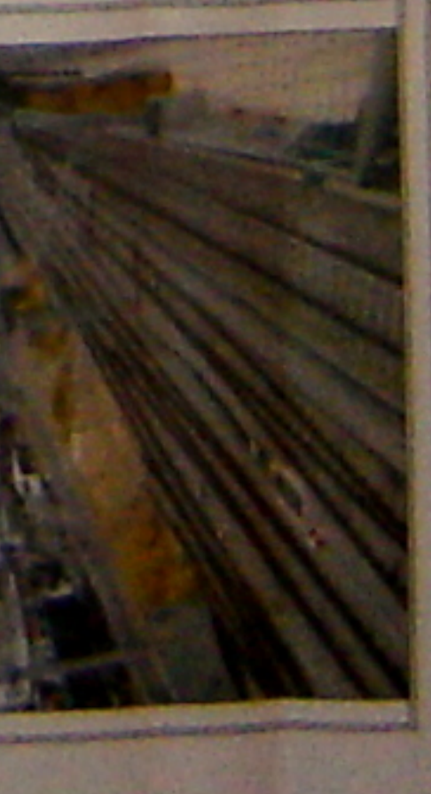
475009 ΦΩΤΟΓΡΑΦΙΑ ΑΠΟ ΒΕΣΗ ΑΓΝΗΣ 4

ΕΠΙΧΕΙΡΗΣΙΑΚΟ ΠΡΟΓΡΑΜΜΑ ΠΡΟΓΡΑΜΜΑ ΑΝΑΠΤΥΞΗΣ ΚΑΙ ΑΝΤΑΓΩΝΙΣΤΙΚΟΤΗΤΑΣ ΕΠΙΧΕΙΡΗΣΙΑΚΟ ΠΡΟΓΡΑΜΜΑ ΠΡΟΓΡΑΜΜΑ ΑΝΑΠΤΥΞΗΣ ΚΑΙ ΑΝΤΑΓΩΝΙΣΤΙΚΟΤΗΤΑΣ