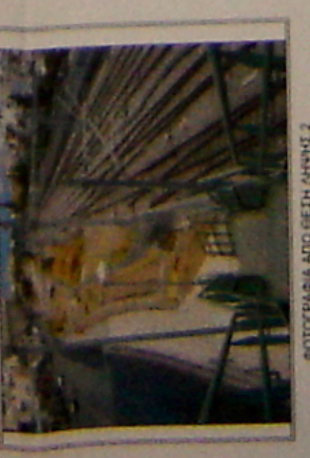
475007 ΦΩΤΟΓΡΑΦΙΑ ΑΠΟ ΒΕΣΗ ΑΓΝΗΣ 2