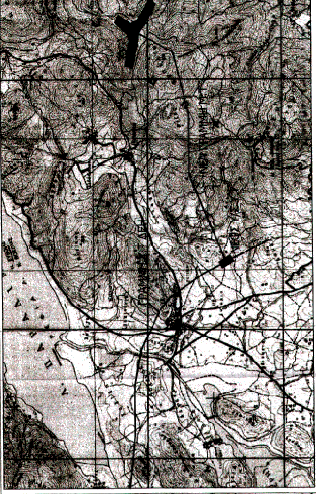
ΑΠΟΨΗ ΕΥΡΥΤΕΡΗΣ ΠΕΡΙΟΧΗΣ ΑΠΟ ΑΠΟΣΠΑΣΜΑ Φ.Χ ΓΥΣ "ΘΗΒΑΙ" ΣΕ ΚΛΙΜΑΚΑ 1:50.000