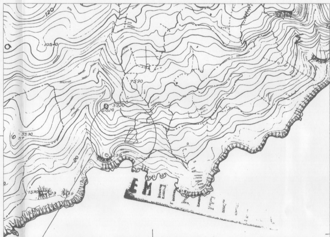
ΑΡΙΘΜΟΣ ΧΑΡΤΗ 9531/2 ΚΛΙΜΑΚΑ 1:5000