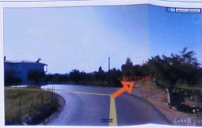
ΑΠΟΣΤΑΣΜΑ ΓΥΝΩΣΤΟ ΜΕΣΣΟΝΗΣ ΣΕ ΚΑΙΜΑΚΑ 1:10.000 ΘΕΣΗ ΙΔΙΟΚΤΗΣΙΑΣ