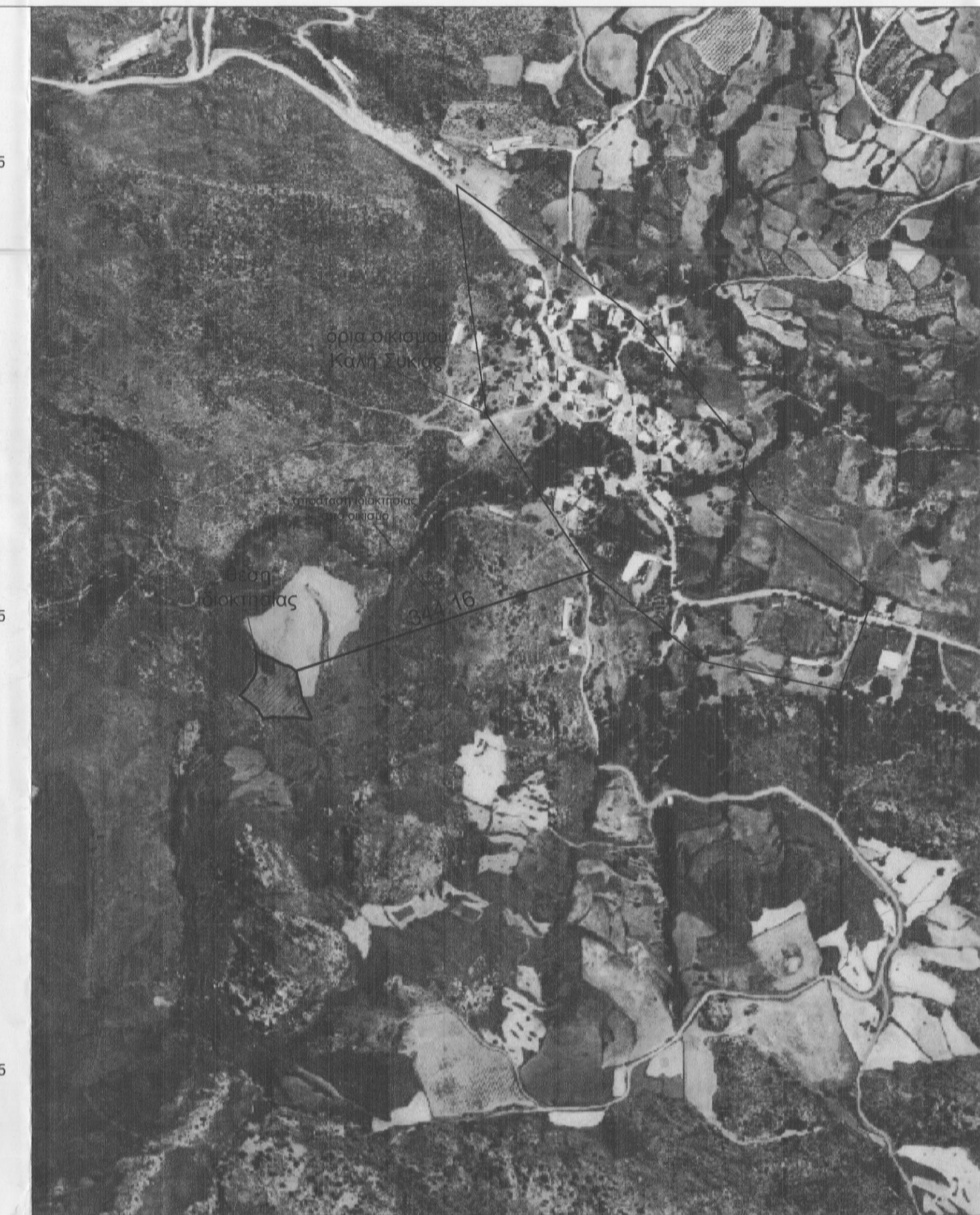
Απόσπασμα ορθοφωτοχάρτη ευρύτερης περιοχής κλίμακα 1:5000