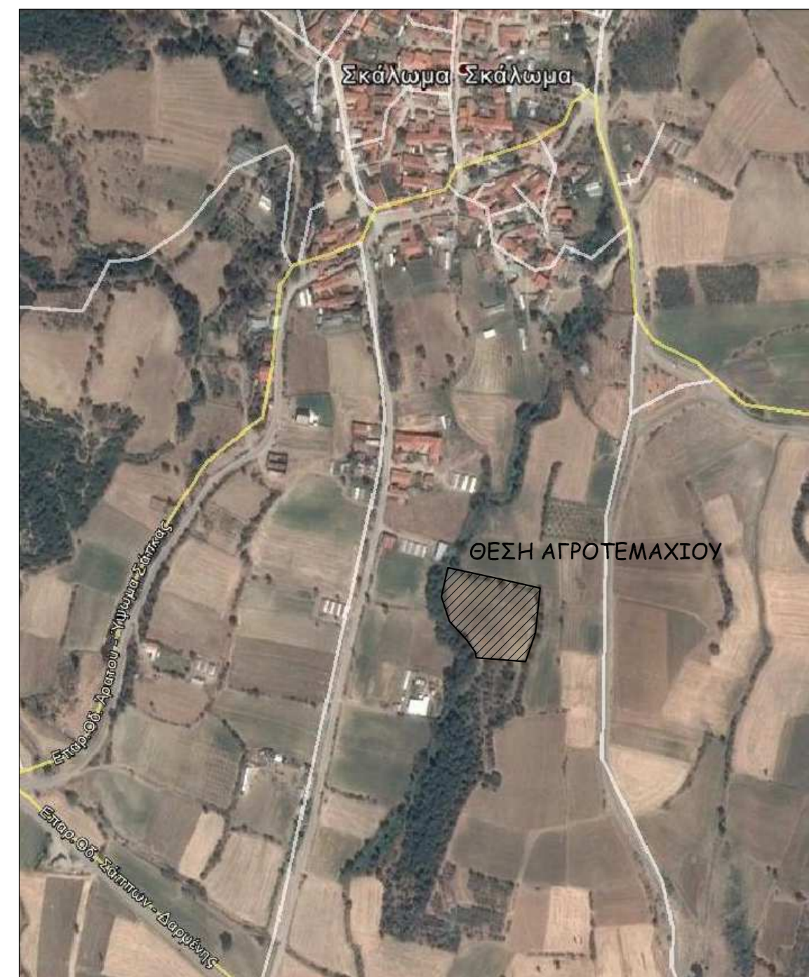
ΔΙΑΓΡΑΜΜΑ ΕΥΡΗΤΕΡΗΣ ΠΕΡΙΟΧΗΣ ΘΕΣΗ ΑΓΡΟΤΕΜΑΧΙΟΥ