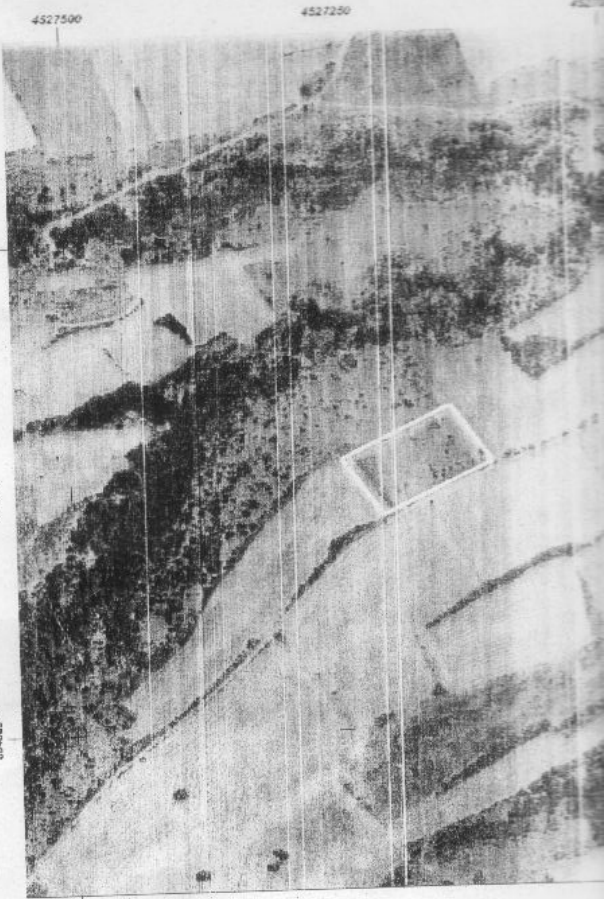
ΔΙΑΓΡΑΜΜΑ ΔΙΑΝΟΜΗΣ ΑΓΡΟΚΗΤΗΜΑΤΟΣ ΑΣΒΕΣΤΑΡΙΟΥ ΥΨΑΛΟΥ Ι

Ο ΔΗΛΩΩΝ ΜΗΧ/ΚΟΣ ΒΑΣΙΛΕΙΟΣ ΠΑΡΑΣΚΕΥΑΪΔΗΣ ΔΙΠΛΩΜΑΤ. ΑΓ. ΤΟΠΟΓΡΑΦ. ΜΗΧΑΝΙΚΟΣ Μ.Ε.Λ.Ο.Σ. Τ.Ε.Ε. ΑΣΚΟΛΟΓΩΝ ΚΑΤΗΓΟΡΙΑ 33962 Π.Α. ΤΑΞΗΜΑΤΙΣΤΩΝ ΠΕΛΛΑΣ ΤΗΛ. 23820-24565 - ΠΕΛΛΗΝΙΑ