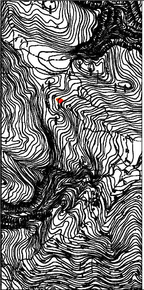
ΘΕΣΗ ΤΕΜΑΧΙΟΥ Α ΣΕ ΑΠΟΣΤΑΣΜΑ ΔΥΝΑΝΟΥ ΧΑΡΤΗ ΤΗΣ Γ.Υ.Ε. 1/5000