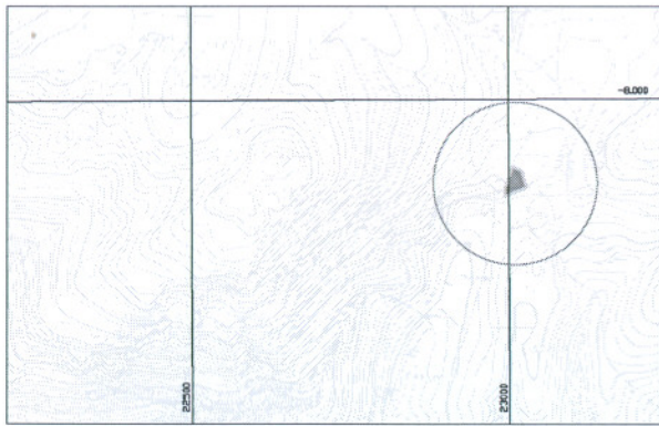
Απόσπασμα Τοπογραφικού Διαγράμματος Γ.Υ.Σ. σε συνίνες Hatt (Αρ. Διαγρ. 61351 Φ.Χ. 1:5.000 ΑΓΙΑ ΕΙΡΗΝΗ) ΚΛΙΜΑΚΑ 1 : 5.000