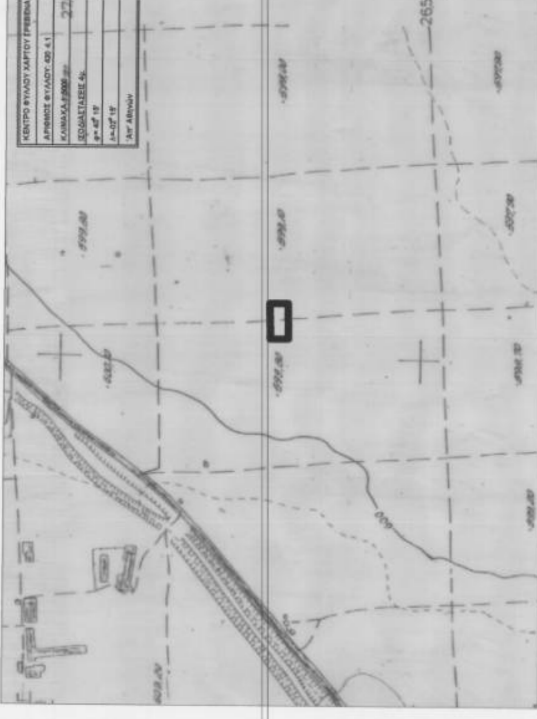
ΑΠΟΣΠΑΣΜΑ ΦΥΛΟΥ ΧΑΡΤΗ ΤΗΣ Γ.Υ.Σ. 1:50000