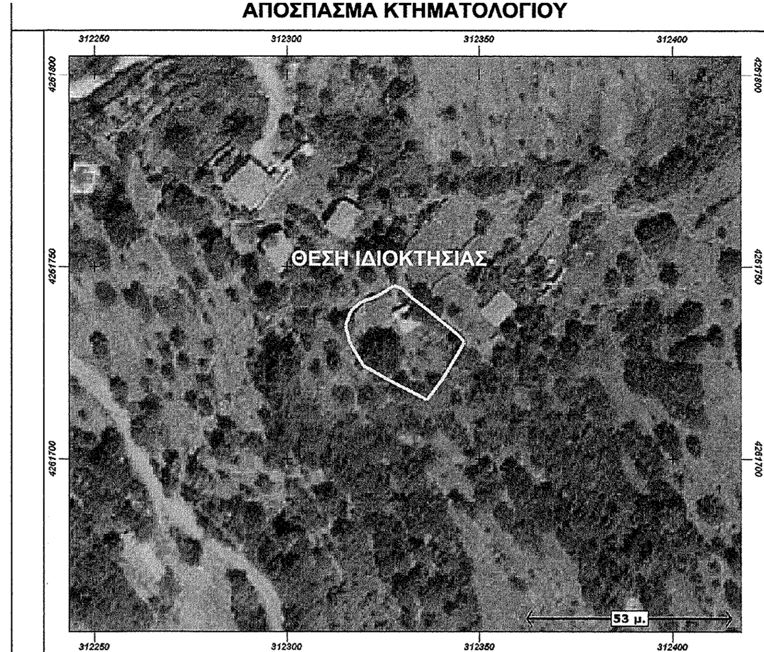
ΠΙΝΑΚΑΣ ΣΥΝΤΕΤΑΓΜΕΝΩΝ Ε.Γ.Σ.Α. '87