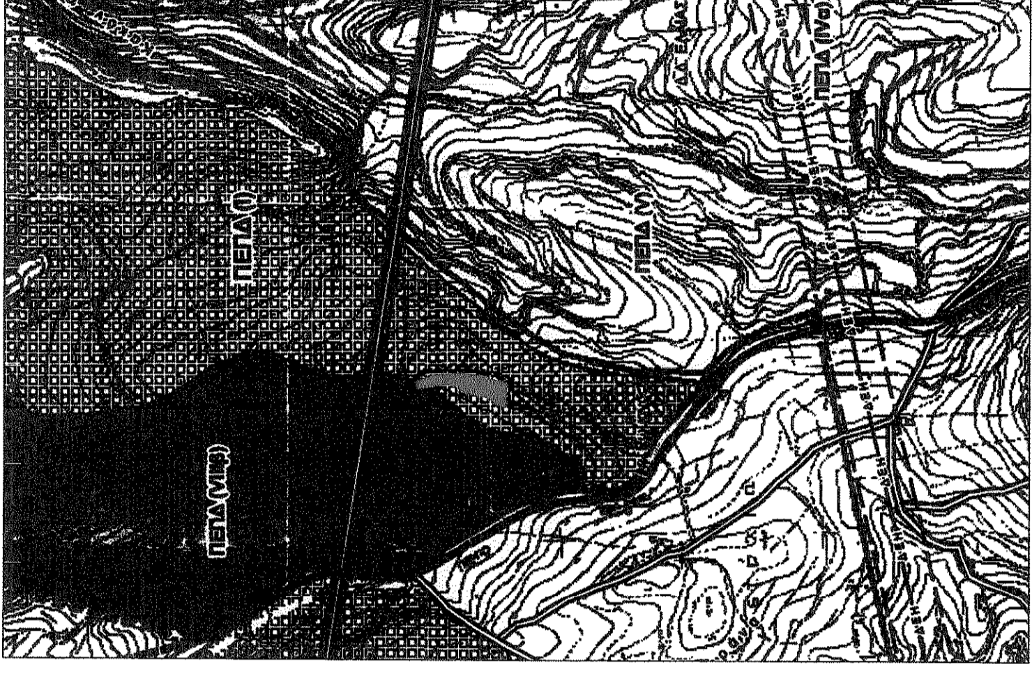
ΣΧΟΟΛΗ ΠΡΩΙΝΗ ΔΗΜΟΥ ΓΟΥΒΩΝ Χρήσεις Γης και Προστασία Περιβάλλοντος ΟΤΑ Αρ. Χάρτη Π.2 ΚΑ. 1:10000