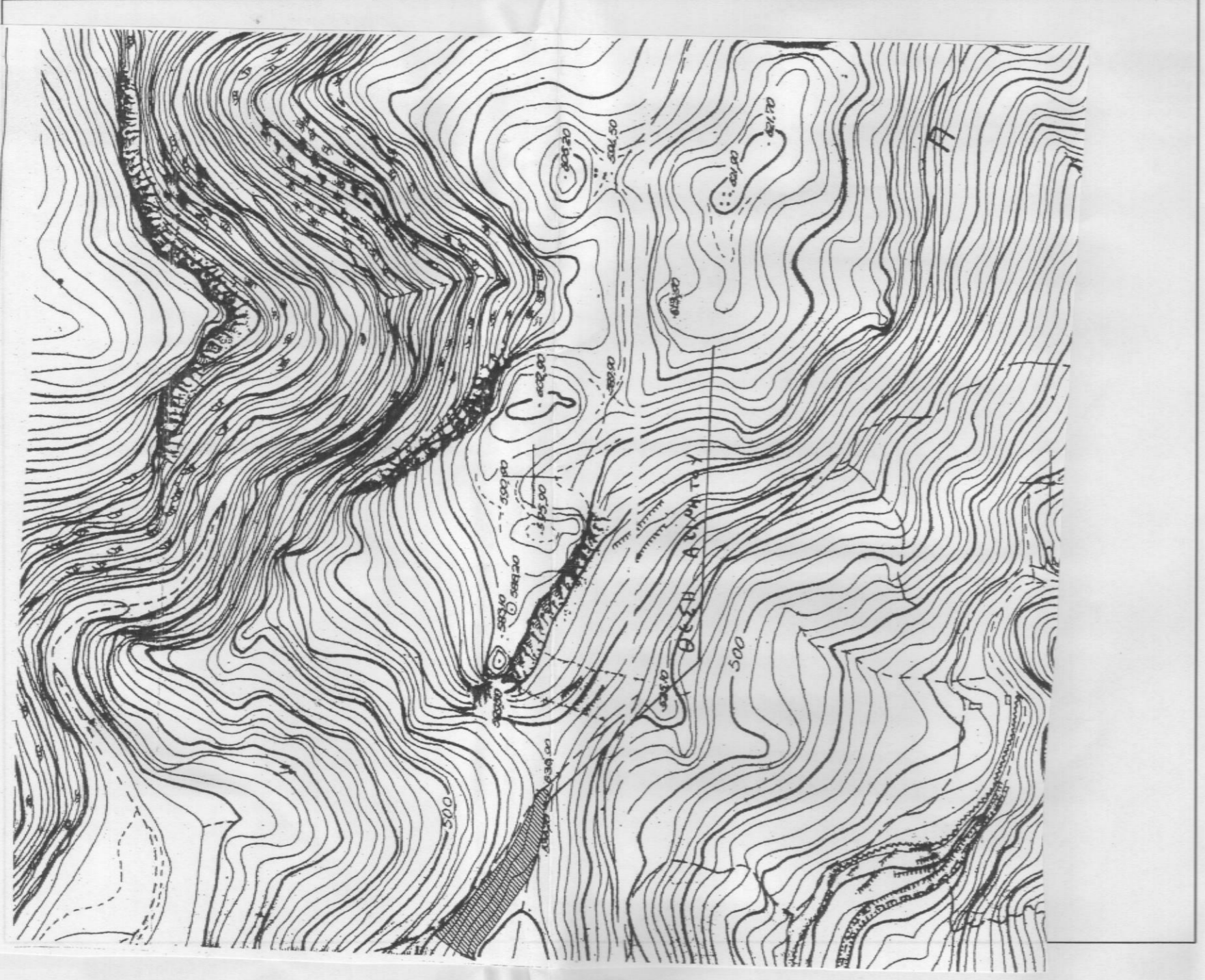
ΧΑΡΤΗΣ ΟΡΟΜΕΤΗΣΗΣ ΠΕΡΙΟΧΗΝ ΚΑΤΩΤΑ ΚΙΛΙΚΙΑ 1/100000

ΑΠΟΣΤΑΣΜΑ ΦΥΛΑΤ ΔΑΡΦΗ ΤΗΣ Γ.Τ.Σ. ΚΙΛΙΚΙΑ 1:5.000