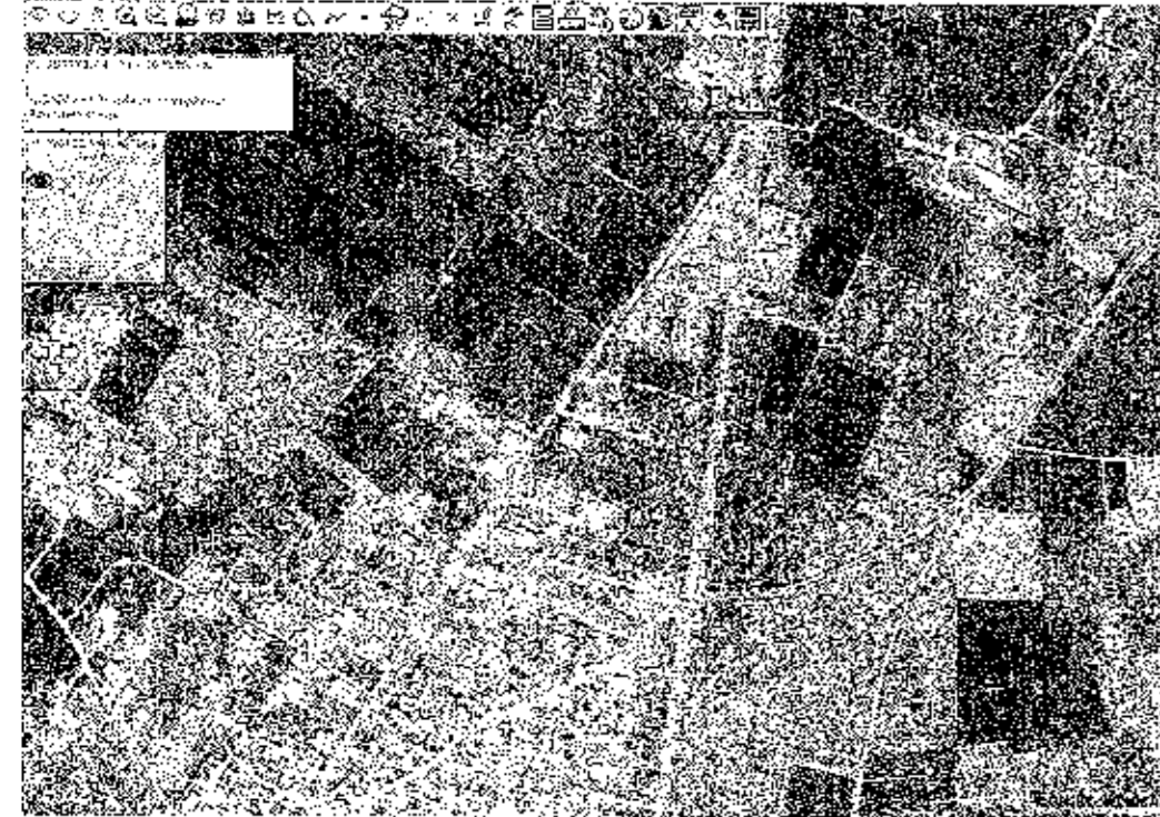
ΑΠΟΣΠΑΣΜΑ ΧΑΡΤΗ Γ.Υ.Σ.