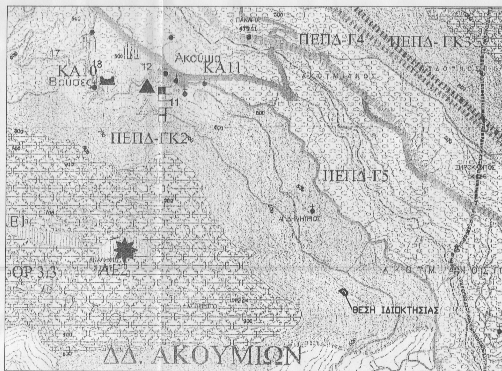
απόσπασμα χάρτη ΦΕΚ 161/ΤΑΑΠ/08-05-2012 (σελ 2164) κλίμακα 1/20.000