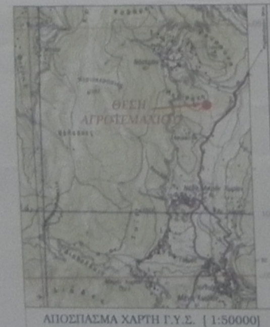
ΑΠΟΣΠΑΣΜΑ ΧΑΡΤΗ Γ.Υ.Σ. (1:50000)